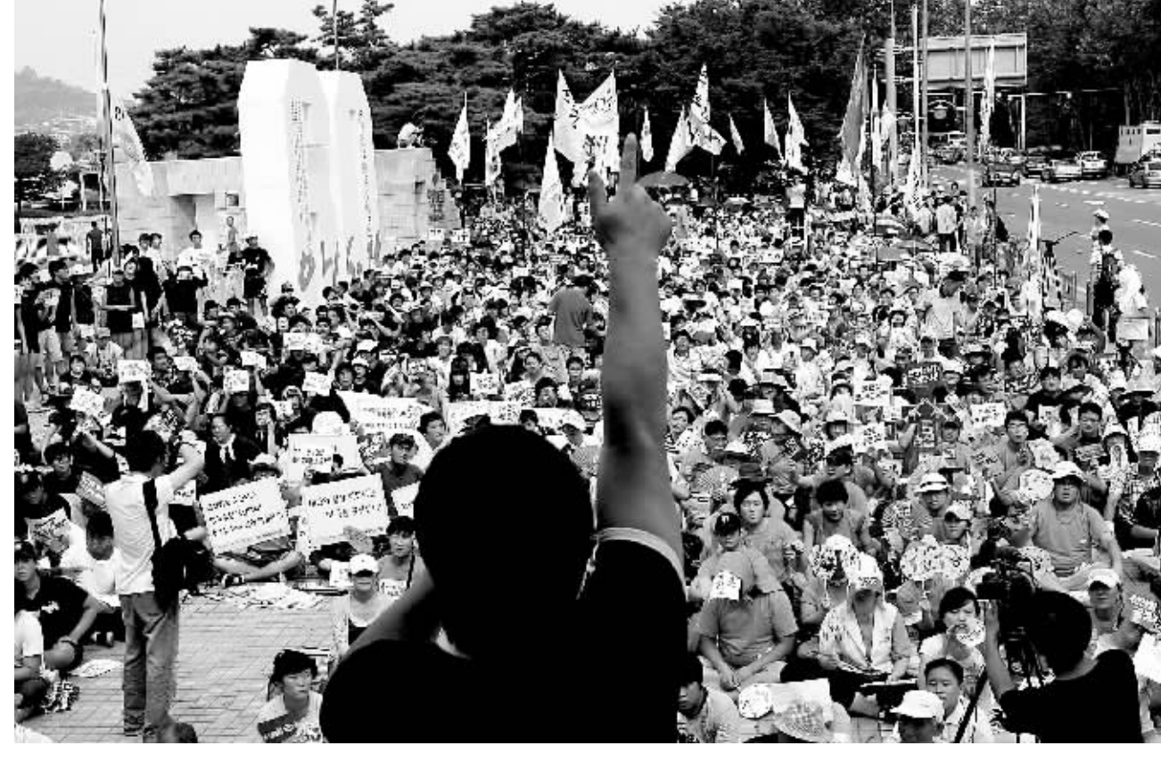
8月15日,在韩国首都首尔,韩国民众在战争纪念馆前集会,反对韩国与美国举行代号为“乙支自由卫士”的联合军演。