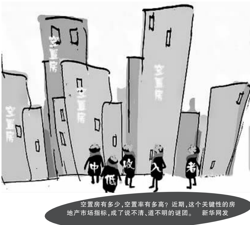
空置房有多少，空置率有多高？近期，这个关键性的房地产市场指标，成了说不清、道不明的谜团。

据新华网8月17日电 空置房有多少，空置率有多高？近期，这个关键性的房地产市场指标，成了说不清、道不明的谜团。各方莫衷一是，统计部门称“要清楚计算出在某一地区”。