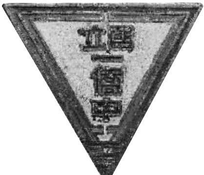
国立第一华侨中学校徽

1992年,海南侨中被国家有关部门评为“中国名校”。2007年,学校被评为海南省一级(甲等)学校、“全国教育系统先进集体”、“全国五四红旗团委”,是国家汉办设立在海南省唯一的汉语国际推广中小学基地。此外,海南侨中还是“全国科学教育实验基地”、“全国青少年科普创新示范学校”、“国家级体育传统项目学校”、“全国群众体育先进单位”以及海南省高中课程改革实验工作综合样本学校、“海南省基础教育课程改革先进单位”。