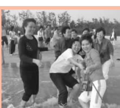
教师生活丰富多彩