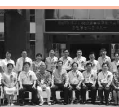
新一届全体董事合影