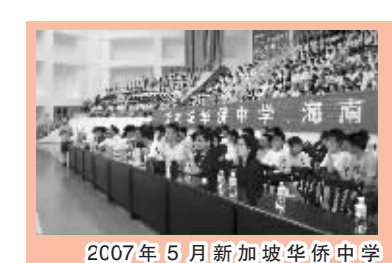
2007年5月新加坡侨中120名师生到海南侨中交流访问

今年6月12日,海南侨中举行了校董会换届选举,正式聘请了校董会7名顾问,包括全国政协常委林明江、澳门中联办副主任李本钧、全国台盟副主席、广东省政协副主席陈蔚文等。同时,还聘请了海内外社会贤达17人作为新一届校董。新校董慷慨解囊,当场为学校基金会捐款212万元,用于支持奖助学金和学校发展。