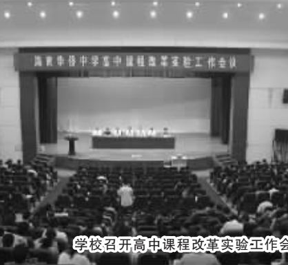
学校召开高中课程改革实验工作会议