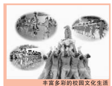
丰富多彩的校园文化生活

2009年5月,舞蹈《震撼》参加第四届全国校园文艺汇演暨第九届全国校园春节联欢晚会表演,并荣获三等奖;8月,学校合唱团荣获首届山东烟台国际青少年合唱独唱周“金杯奖”、“精神风尚奖”、“团体总分奖”;舞蹈《足迹》参加“文华艺术院校奖”第九届“桃李杯”舞蹈比赛,荣获优秀表演奖。