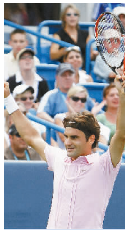
23日,在美国举行的辛辛那提网球大师赛男单决赛中,费德勒以2:1战胜美国选手费什,获得冠军。