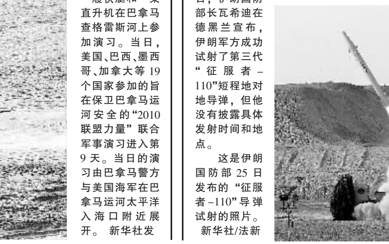
8月25日,伊朗国防部长瓦希迪在德黑兰宣布,伊朗军方成功试射了第三代“征服者-110”短程地对地导弹,但他没有披露具体发射时间和地点。这是伊朗国防部25日发布的“征服者-110”导弹试射的照片。