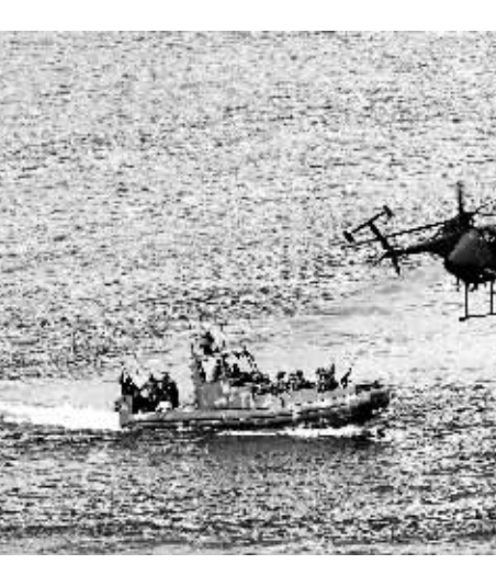
8月25日,一艘快艇和一架直升机在巴拿马查格雷河上参加演习。当日,美国、巴西、墨西哥、加拿大等19个国家参加的旨在保卫巴拿马运河安全的“2010联盟力量”联合军事演习进入第9天。当日的演习由巴拿马警方与美国海军在巴拿马运河太平洋入海口附近展开。