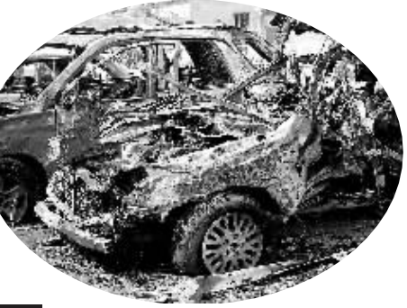
8月25日,在巴士拉,几辆汽车在炸弹袭击事件中损毁。

核心提示:25日一天内,伊拉克9个省接连发生了14起爆炸事件,根据伊内政部和各地警方人士的消息,目前袭击已造成64人死亡,另有272人受伤。