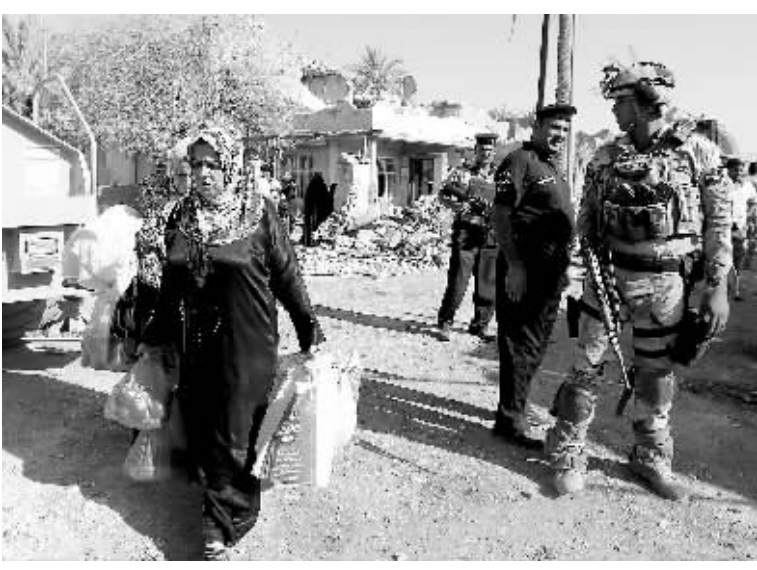
8月25日,伊拉克安全人员在巴格达发生爆炸袭击的地点附近值勤。

的国家之一。长期战乱和经济制裁,使2700多万伊拉克人的生活条件进一步恶化,失业率高达25%以上。普通伊拉克人在承受丧失亲人的痛苦、生命受到威胁的同时,还得应对缺油、缺电、恶性通货膨胀、恶劣的医疗状况等生活难题。