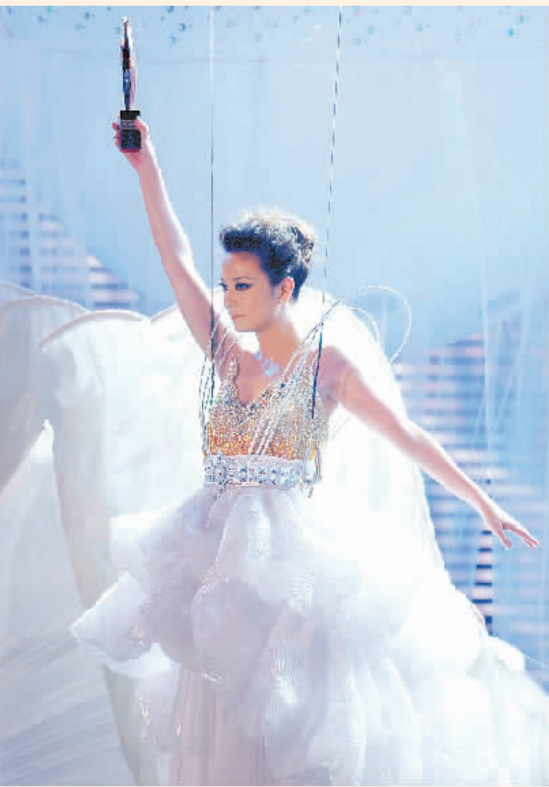
→赵薇凭借《花木兰》获得影后