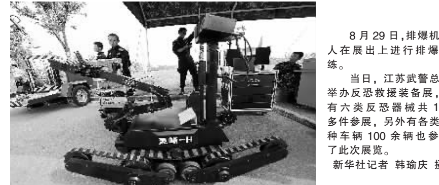
8月29日，排爆机器人在展台上进行排爆演练。

当日，江苏武警总队举办反恐救援装备展，共有六类反恐器械共100多件参展，另外还有各类特种车辆100余辆也参加了此次展览。