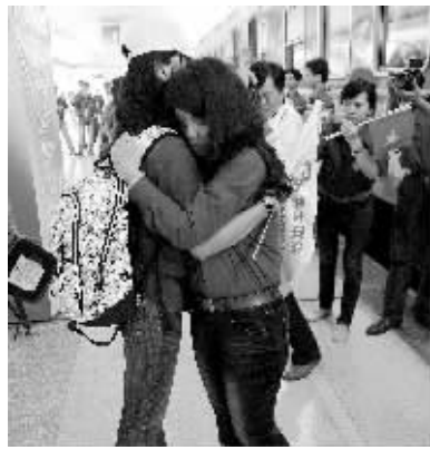
8月29日，中越青年代表互相拥抱，依依惜别。当日，中越青年大联欢活动圆满落幕，3000多名越南青年乘坐列车返回越南。

农德孟在贺电中说，越中青年朋友欢聚在一起，共同参加大联欢活动，继承老一辈的传统友谊，携手共创中越友谊新篇章。我代表越南党和政府向越南人民，向参加中越青年大联欢活动的青年代表，并通过你们向两国青年致以亲切的问候和良好的祝愿。希望两国青年发挥聪明才智，为中越两国的团结和友谊创造更加美好的明天。