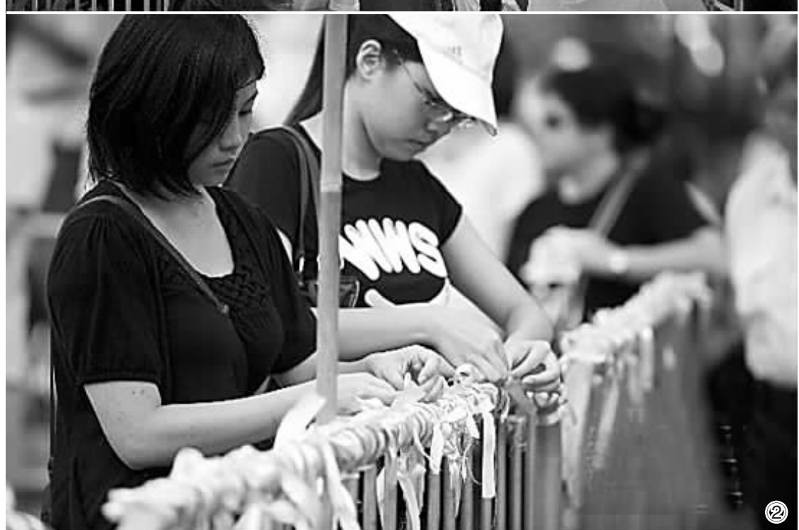
① 8月29日,游行者在维多利亚公园默哀。② 8月29日,游行市民把黄丝带绑在遮挡花园的栏杆上,哀悼遇难同胞。