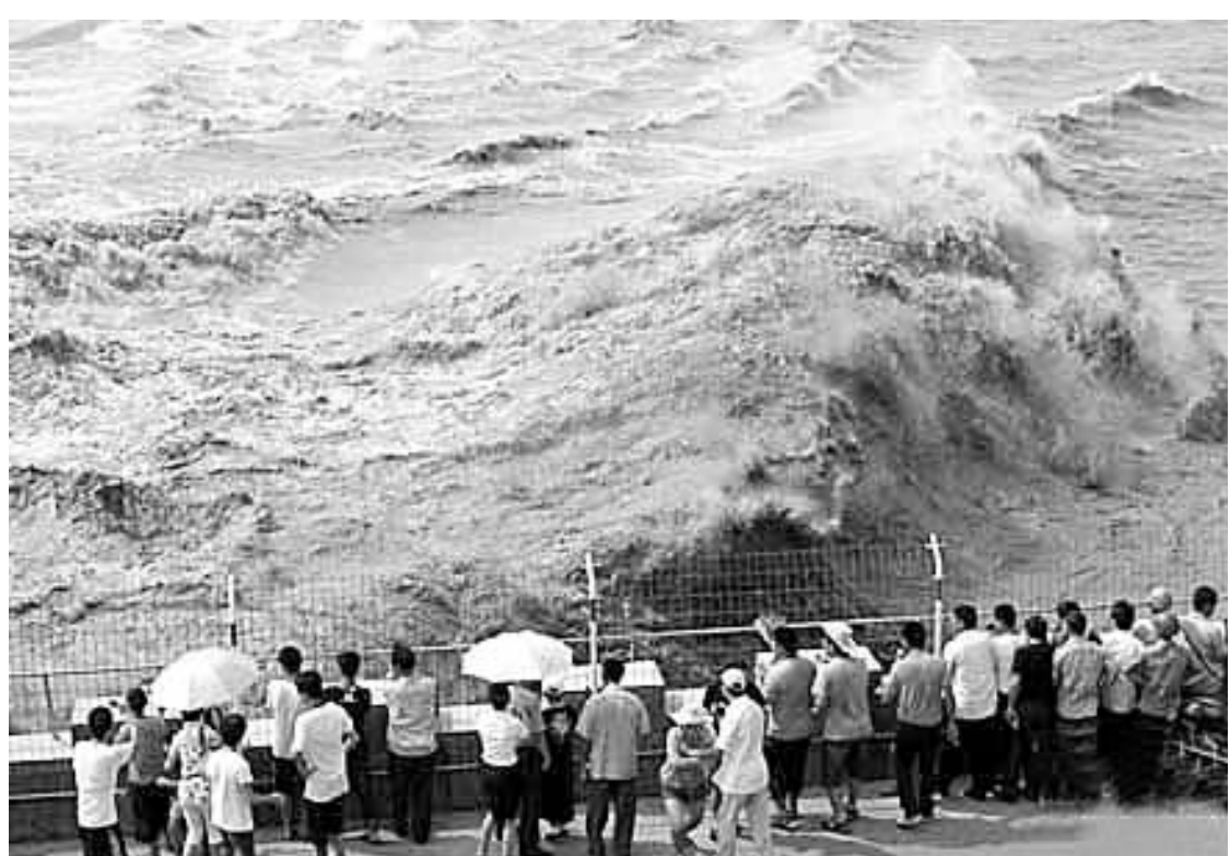
8月27日,正值农历七月十八,钱塘江涌来今年第一波大潮。