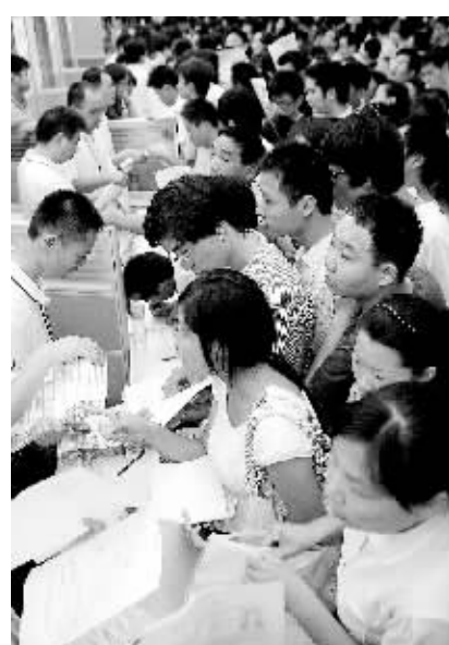
资料照片:8月14日,众多应聘者在富士康招聘台前咨询应聘。