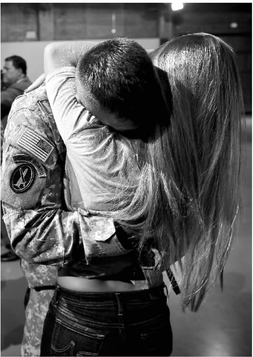
8月28日,在美国首都华盛顿附近的迈尔堡军事基地,从伊拉克返回的美军士兵与亲人团聚。

路透社分析,民主党因经济议题备受压力,可能输掉11月国会中期选举,白宫正努力强调奥巴马在伊拉克战争上的政绩,以鼓舞民主党人。