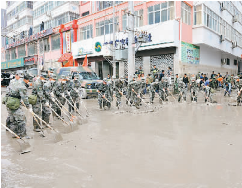
8月30日,兰州军区某部官兵对县城淤泥进行清理。

志指出,堰塞湖应急处置及白龙江清淤疏通,是舟曲山洪泥石流抢险救灾工作的关键环节。军地有关方面始终坚持对人民高度负责的精神和“安全、科学、迅速”的原则。