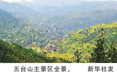
五台山主景区全景。

新华社太原8月30日专电 (魏巍 高峰)素有“金色佛国”之称的五台山不仅是“清凉圣境”,也因其面积广阔、地质迥异和丰富的地质资源被称为“地质圣地”。30日上午,随着五台山国家地质公园开园揭牌,五台山有了又一张亮丽“名片”。