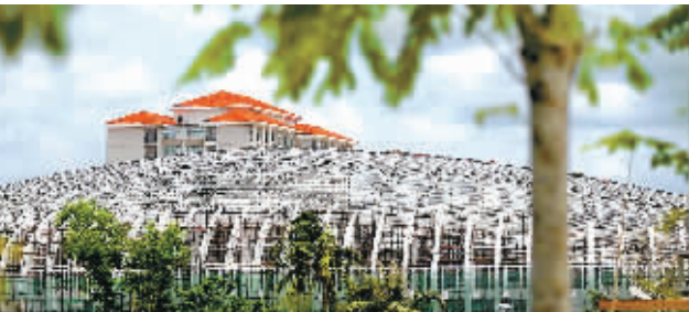
8月31日,三亚体育中心体育场主体建筑完工。该体育场占地面积3.8万余平方米,建筑面积1.65万平方米,建成后容纳1.6万名观众。