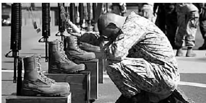
伊拉克战争五周年,驻伊美军阵亡总人数将近4000人,美英部队也都各有伤亡,图为一名美国海军陆战队下士在加利福尼亚州彭德顿堡悼念阵亡战友。