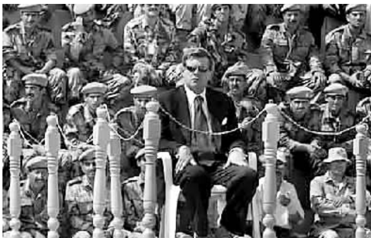
2003年10月4日,盟国驻伊拉克临时管理当局最高行政官员保罗·布雷默(L.Paul Bremer),亲自出席萨达姆政权被推翻之后,重新组建的伊拉克军队结业典礼。伊拉克新军队由美方协助训练,当天也是首批士兵学员完成培训。