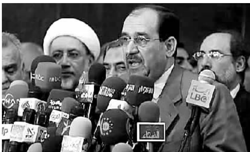
2006年4月,历时四个月的政治僵局终于化解,伊拉克人民选出以什叶派总理马利基为首的新一届民选政府。