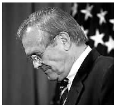
2006年11月8日,布什总统宣布国防部长拉姆斯菲尔德辞职,并将由前中央情报局(CIA)局长罗伯特·盖茨取而代之。