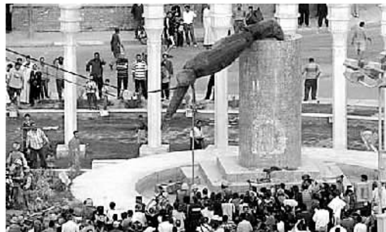
2003年4月9日,巴格达菲尔杜斯广场,萨达姆雕像在伊拉克民众瞩目中被推倒。