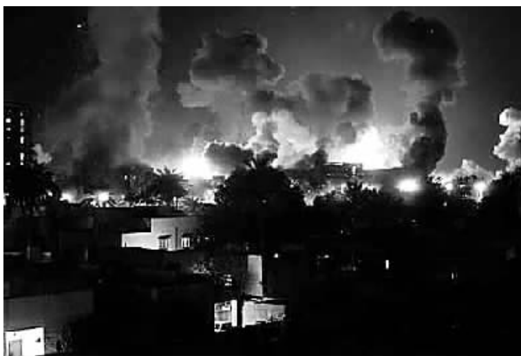
2003年3月21日,以美国为首的多国部队,大规模空袭伊拉克首都巴格达。

奥巴马8月31日20时(北京时间9月1日8时)在美国白宫椭圆办公室就驻伊美军作战部队8月底撤离发表讲话