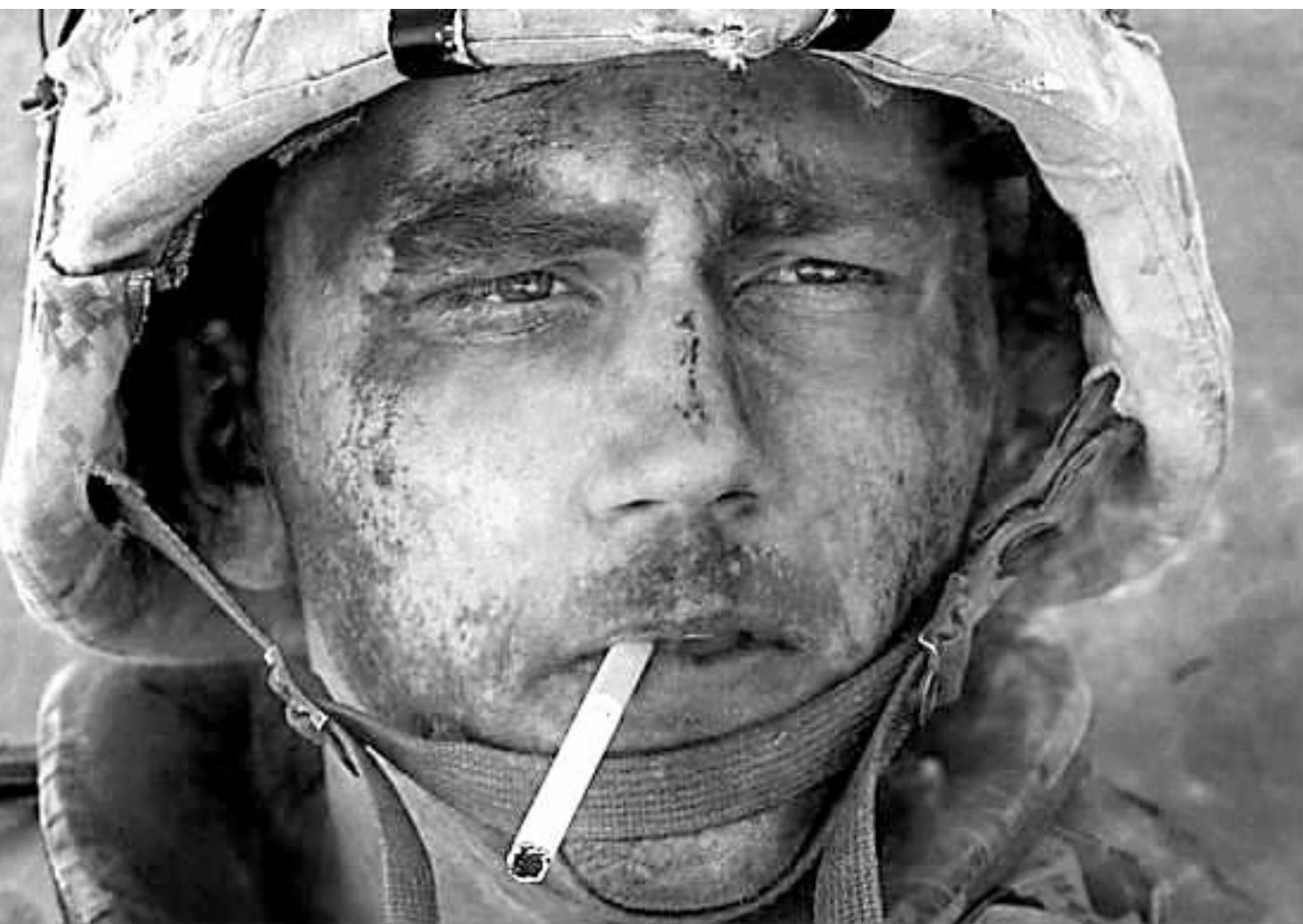
美国海军陆战队第一师第八团士兵兰斯下士,吸香烟照片。被称为“万宝路男人”。这张照片被当做美国伊拉克战争的标志性照片。