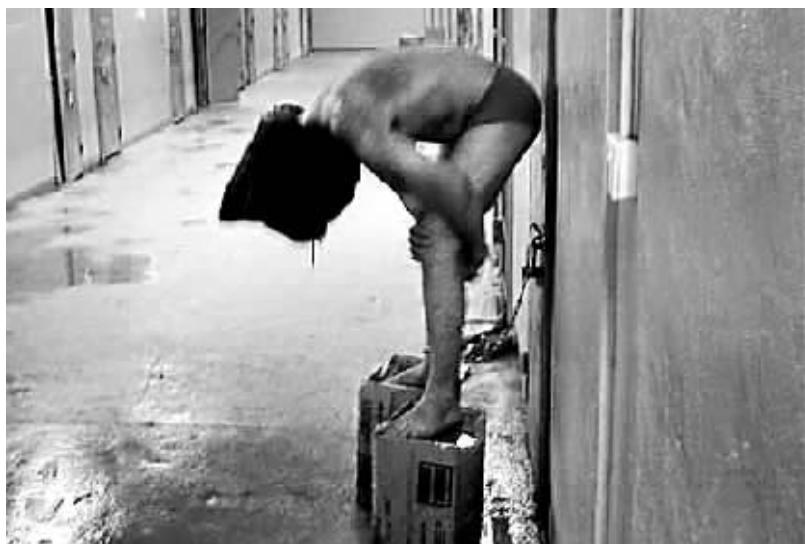
2004年4月-5月,驻伊美军阿布格莱卜监狱虐囚丑闻曝光,大量虐囚图片公诸于世。