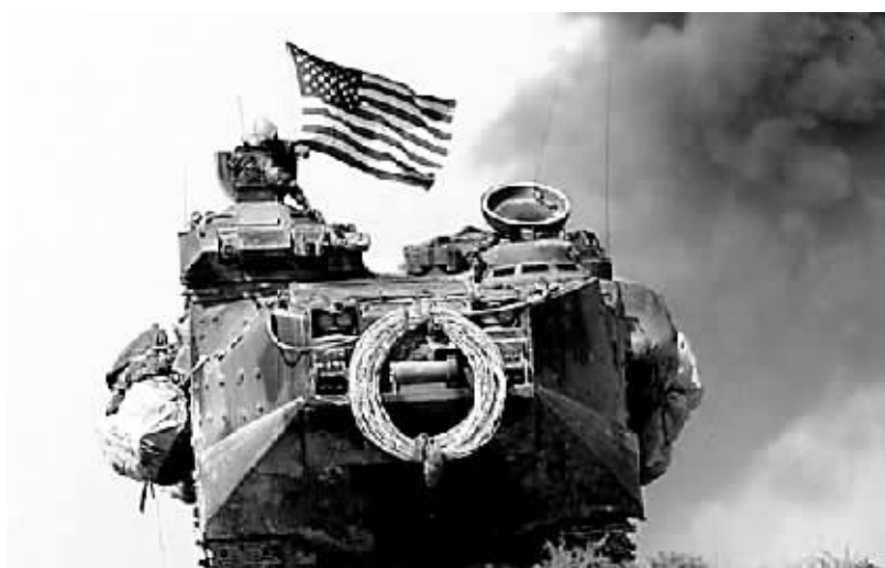
美海军陆战队突击装甲车。