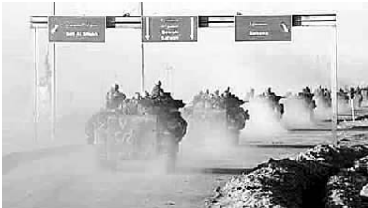
2003年4月3日,美国海军陆战队全副武装,浩浩荡荡开进伊拉克,如入无人之境。