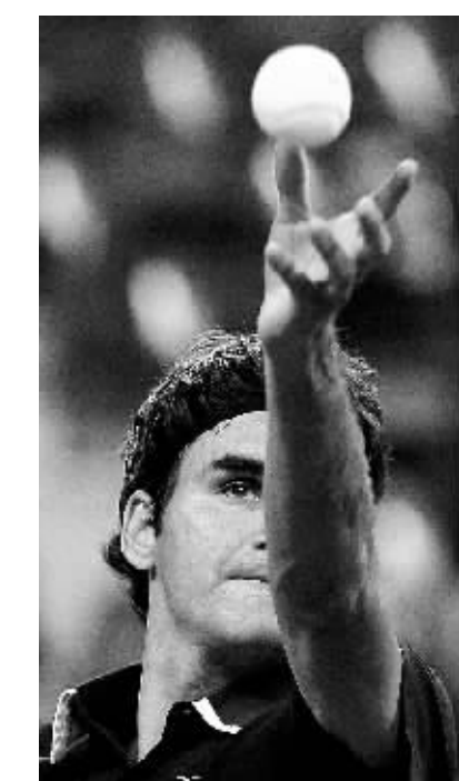
与索德林之战，费德勒的发球威力尽显。

本报讯 美国当地时间8日，尽管萧瑟的秋风再度光临美国网球公开赛赛场，可它依然无法阻挡夺冠热门费德勒进军四强的脚步。费德勒以3:0横扫索德林，挺进四强。在连续两项大满贯止步八强之后，费德勒时隔八个月回到大满贯四强行列。 费德勒和小德在网坛很“默契”，他们此前已连续3年在半决赛中相遇，都是费德勒获胜。今年两人连续第4次相遇美网半决赛，鹿死谁手还是个未知数。 从过去几年的美网战绩上看，费德勒无疑是这里当之无愧的霸主。而小德的表现也十分稳定，综合表现仅比费德勒逊色。这一次两人再度相逢，没有人会束手就擒。 小德今年的总体表现并不理想，前三个大满贯最好的成绩是温网四强，而他上一次闯入到大满贯决赛还是2008年澳网的事情。此番出征美网虽备受外界质疑，但小德还是一路杀入半决赛，而且状态一天比一天出色，在八强战中，他以3:0横扫扫力四射的法国选手孟菲尔斯。 费德勒此次是连续第7次杀入美网四强，但在他的眼里可只有冠军，在法网和温网的连续失利后，他需要此次美网冠军来证明自己还没有老。可以预料费德之战将是一场火药四射的进攻战，两人将为球迷奉献出一场华丽的视觉盛宴。(森森)