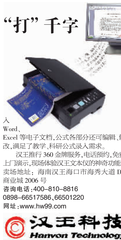
汉王科技 Hanvon Technology