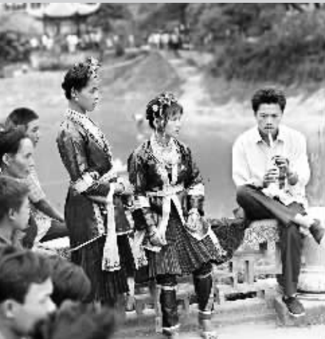
1980年中秋 这是1980年,广西柳州市鱼峰山举行的中秋节山歌会上,一个侗族的民歌手在吹侗笛。