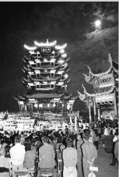
1988年中秋 这是1988年,武汉市举行规模盛大的黄鹤楼中秋赏月盛会,中外游人在黄鹤楼前欣赏文艺演出。