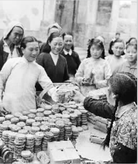
1963年中秋 这是1963年中秋节,山西省运城大渠公社寺北村大队的社员在购买本村供销社供应的月饼。