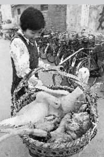
1991年中秋 这是1991年中秋节前,重庆之后的江苏省里下河地区节日气氛浓郁。高邮市湖滨乡新农村村这位姓秦的姑娘正准备给妈妈送去传统的中秋礼品——肥鹅、鲜藕、月饼。

春播、夏收、秋获、冬藏是主要的劳作活动。土地收成情况,对于以此为生的人们来说至关重要。因此,人们对土地还有深深的敬畏之情。每到春天播种之时,都会祭祀土地神,祈求土地神赐予五谷丰登,这种活动被称为“春祈”。