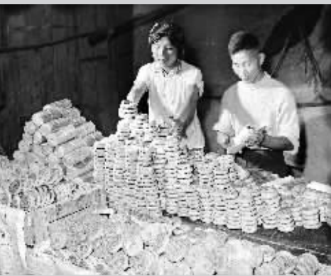
1961年中秋 这是1961年9月21日,山西省闻喜县东镇供销社合作社的工作人员在包装月饼,准备供应农民过中秋节。