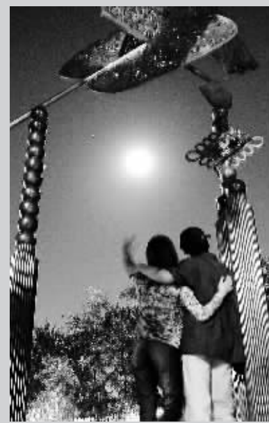
2002年中秋 这是2002年中秋之夜,一对情侣在北京菖蒲河公园赏月。