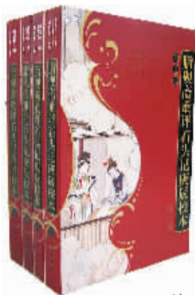
庚辰本原貌（包括其脂批）的校订本。国内外首次出版的一部全面反映《红楼梦》