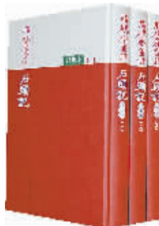
脂砚斋重评石头记己卯本

程甲本、程乙本都是120回本，卷首都有绣像，相对于80回本而言，“全本”无疑更有吸引力。人物有了归宿，故事有了结局，显然有助于此书流传。俞平伯临终那句“程伟元、高鹗是保全红楼梦的，有功”的遗言，说出了《红楼梦》传播的实情，经得起历史检验。不过，这后40回续书，究竟出自何人之手，迄今为止并无定论，是高鹗续补，还是他人撰补？众说纷纭。人民文学出版社2007年出版《红楼梦》校注本第三版时，已将作者署名改为“前八十回曹雪芹著，后四十回无名氏续，程伟元、高鹗整理。”人民文学出版社古典部主任周绚隆曾对记者说明如此署名的理由：“没有可靠的材料证实高鹗就是后四十回的续者，因而吸取冯其庸等红楼梦研究学家的意见，把作者改为无名氏。”高鹗由续作者变成了“整理者”，表面看地位下降了，实际上可能更接近事实真相。