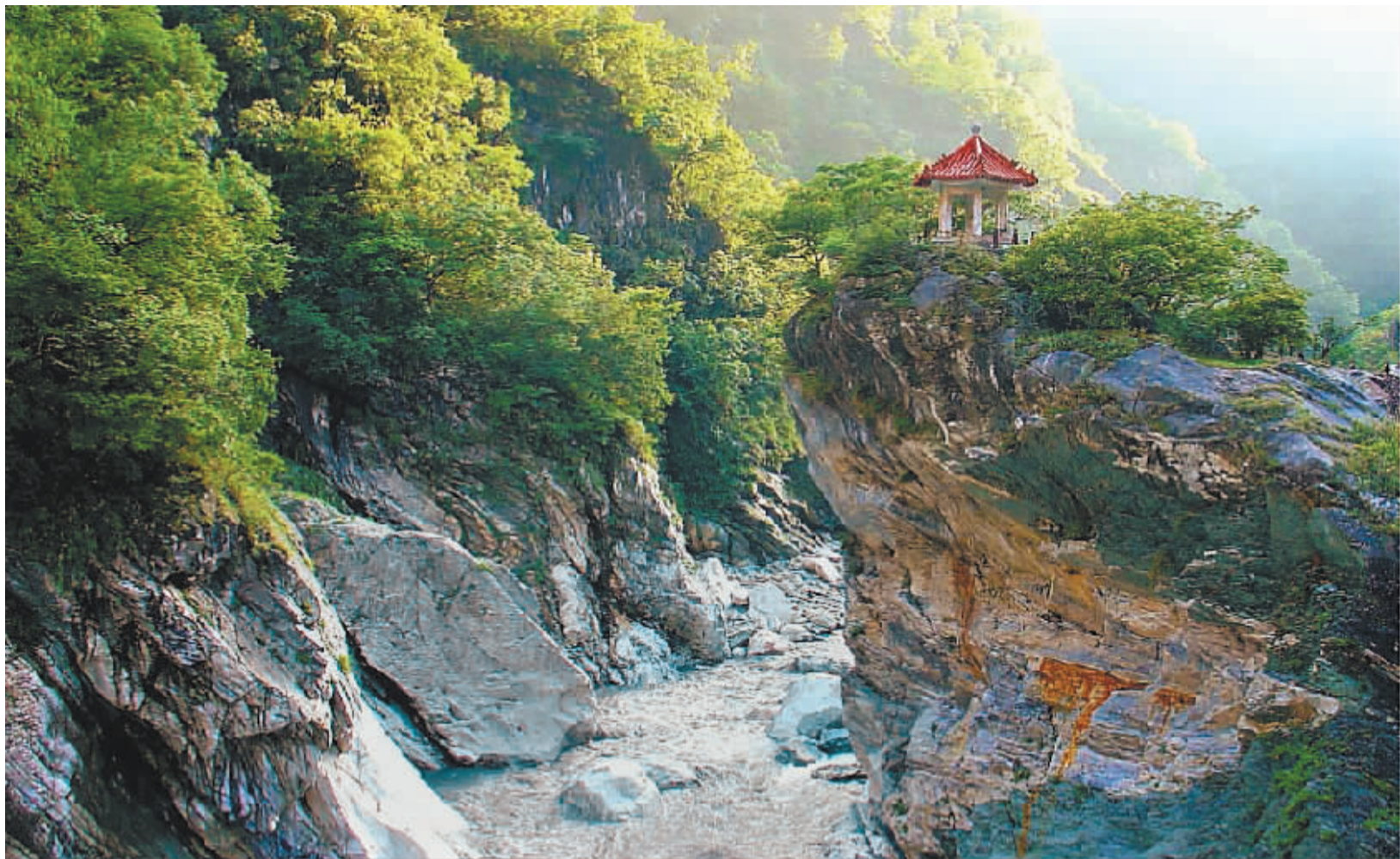
太鲁阁大峡谷中的慈母亭。