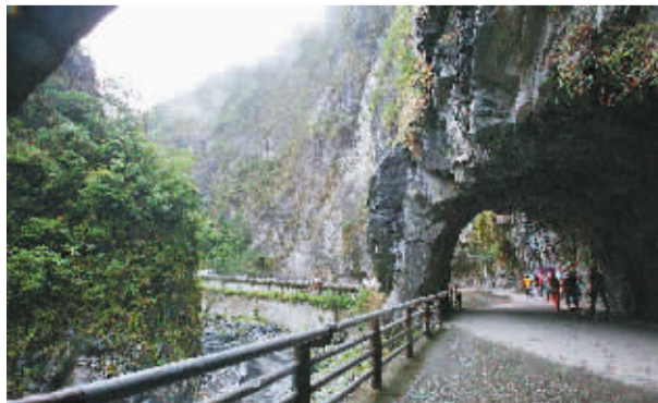
太鲁阁大峡谷中的九曲洞。

台湾之行结束了,尽管已返家数日,我心中依然有一缕缕悠长的思绪,缠绕在神奇的太鲁阁大峡谷幽幽山谷中。