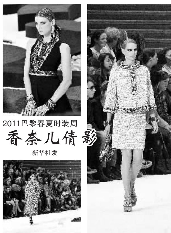
2011巴黎春夏时装周 香奈儿倩影