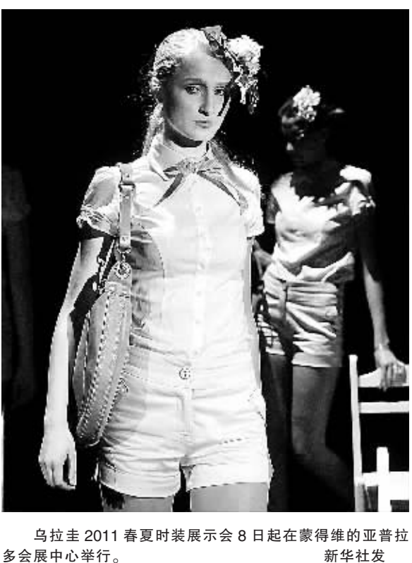
乌拉圭2011春夏时装周展示会8日起在蒙得维的亚普拉多会展中心举行。