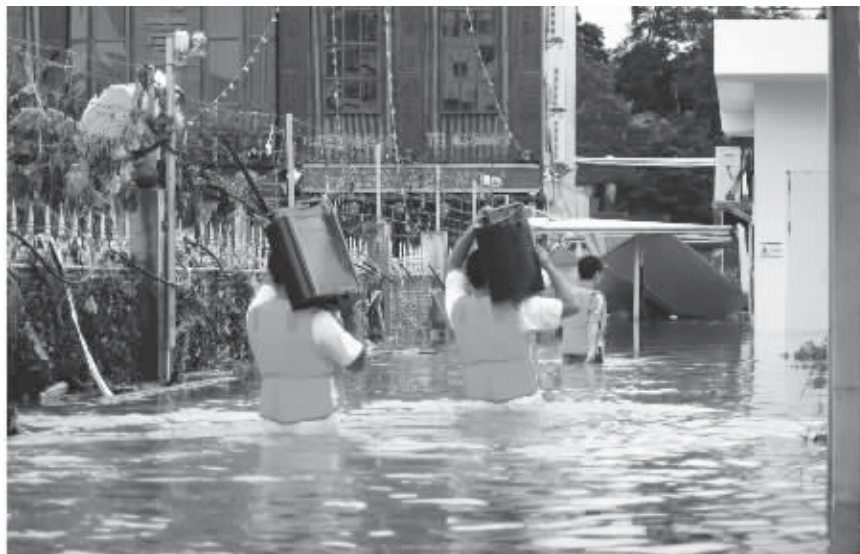
维护人员涉水运送发电机以保障文昌移动通信畅通。

记者报道，特大暴雨袭击广东珠三角地区，中国移动通信集团广东分公司领导第一时间赶赴一线，全力保障广东珠三角地区的通信畅通。在暴雨袭击期间，中国移动通信集团广东分公司领导第一时间赶赴一线，全力保障广东珠三角地区的通信畅通。在暴雨袭击期间，中国移动通信集团广东分公司领导第一时间赶赴一线，全力保障广东珠三角地区的通信畅通。