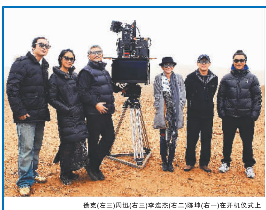
徐克(左三)周迅(右三)李连杰(右二)陈坤(右一)在开机仪式上

作为中国幽默喜剧艺术的“重镇”之一,陕西省从1986年到1996年,曾连续举办了8届“陕西省喜剧小品电视表演赛”,但由于种种原因中断。陕西幽默喜剧艺术的发展从此陷入了低谷,2010年举办的首届幽默喜剧电视展演有望重振陕西幽默喜剧艺术雄风。