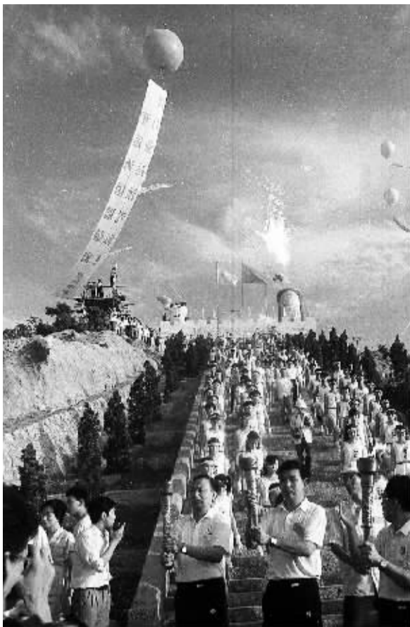
1990年8月23日,三亚南端点火台圣火点燃,随后,亚运会火炬沿东、中、西三路传递。

广州亚运会即将举行,在亚运之光重新普照中华大地的时候,我们再次走近南端点火台,触摸那段穿越20年的记忆。