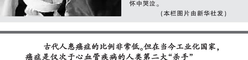
↑这是2002年7月13日,一名5个月大营养不良的阿富汗婴儿在母亲怀中哭泣。

食和生活习惯导致。”英国约三分之一人患癌症。世界癌症研究基金会的蒂切特·汤普森博士说:“在英国,有大约三分之一的人患癌症。这一疾病在世界其它地区的发病率也相当高。