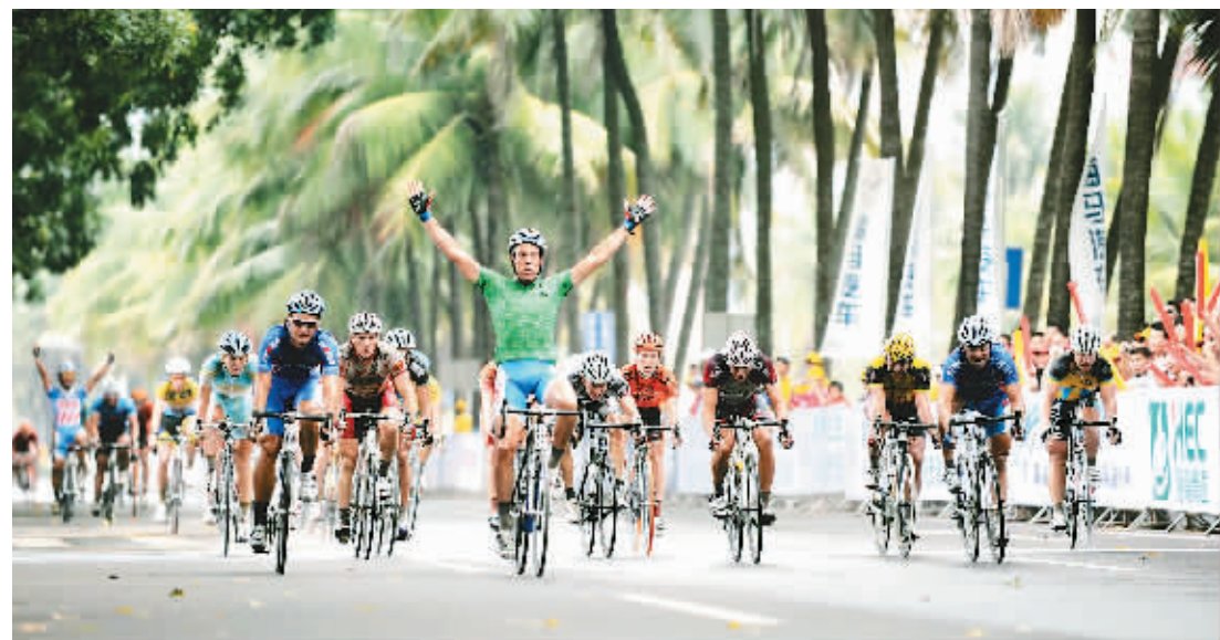
10月15日,环岛赛第五赛段比赛在海口市滨海大道进入最后的冲刺。