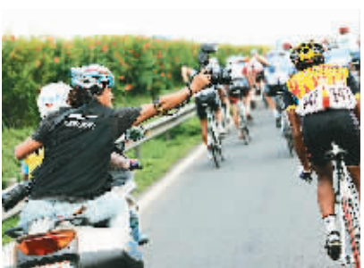
10月15日,一位乘坐摩托车的摄影记者在抓拍比赛镜头。