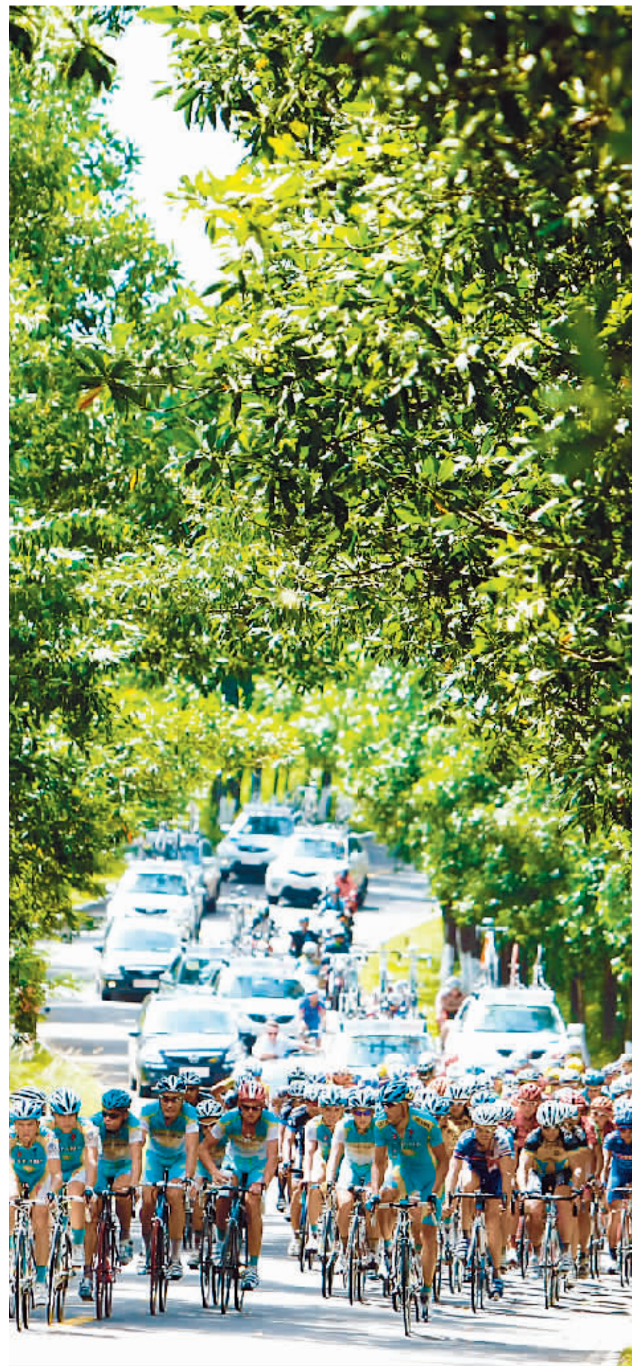
10月15日,参赛车手骑行经过定安境内,道路两旁的成荫绿树给各国参赛选手留下深刻印象。