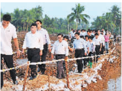
↑10月19日下午，回良玉前往文昌市会文镇官公铺村了解灾情。

10月19日到20日，受胡锦涛总书记和温家宝总理委派，中共中央政治局委员、国务院副总理、国家防汛抗旱总指挥部总指挥回良玉，深入海南重灾区，代表党中央、国务院看望慰问奋战在抗洪抢险救灾一线的广大干部群众、解放军指战员、武警官兵和公安民警，实地察看灾情，指导抗洪救灾和恢复重建工作。