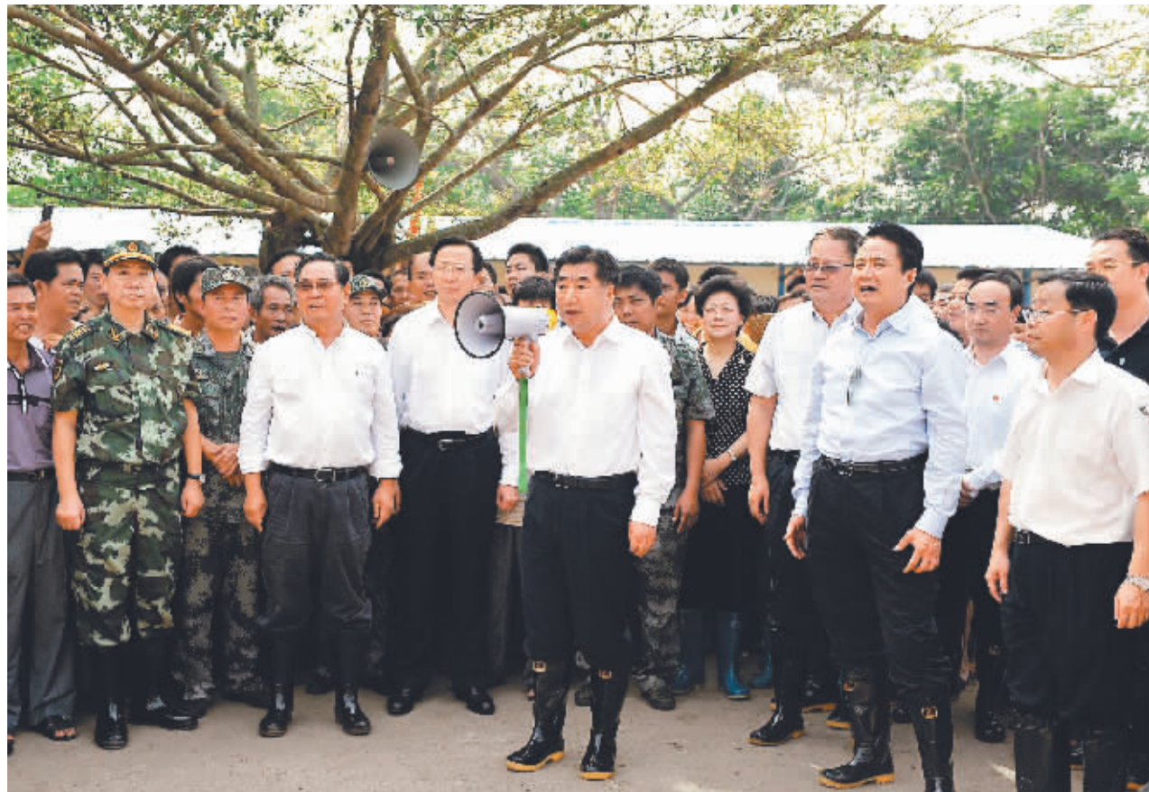
↑10月19日中午，回良玉在海口市琼山区龙塘镇龙新村村委会文南村慰问受灾群众和救灾部队。