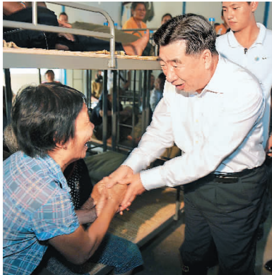
↑10月19日中午，回良玉在海口市琼山区龙塘镇龙新村村委会文南村慰问受灾群众。