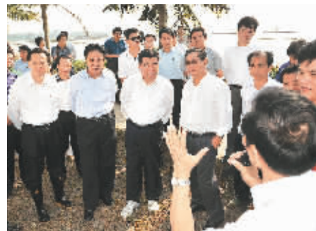
↑10月19日下午，回良玉在海口市琼山区三江湾万亩水产养殖、大田洋瓜菜基地考察灾情。要求确保冬季瓜菜的及时补种、生产。