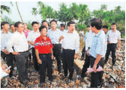
↑10月19日下午，回良玉在文昌市会文镇官公铺村向村支书（红衣者）了解水库决口前组织群众转移和村庄受灾情况。