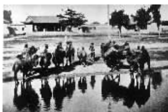
1927年圆明园绮春园大门旧景