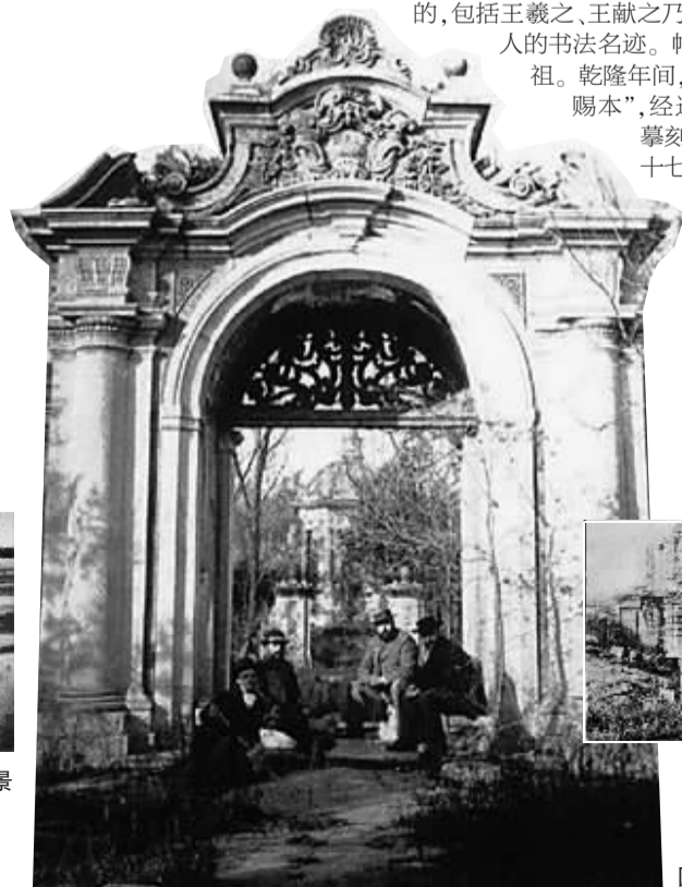
圆明园谐奇趣以北的花园门