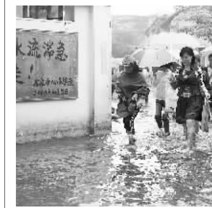
11月4日,海口龙泉镇中心小学门口积水依然很深。

本报海口11月5日讯(记者张杰)“点到名字的同学,请上台领取新书包。”昨天下午,在海口市龙华区龙泉镇中学被临时借用的教室里,该镇中心小学六年级(1)班的梁老师将爱心企业捐赠的书包,送到了家里遭