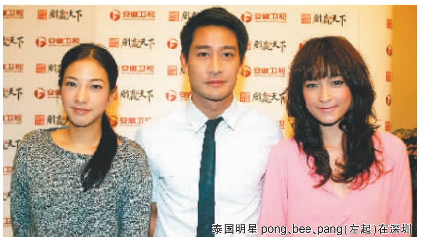
泰剧明星pong,bee,pang(左起)在深圳

召力。安徽卫视有关人员介绍,当安徽卫视在微博上发布Pong,Bee,Pang三位演员将来华的消息后,当天就有100多名观众上微博留言,而当三人终于现身深圳时,竟有观众从全国各地飞到深圳迎接他们,其中还有一位辽