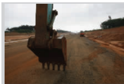
正在建设中的滨海路

该市十一届四次全会提出了未来五年发展大规划,计划投入247亿元用于基础设施建设,即到2012年本届班子任期届满为第一阶段,到2014年“两桥一路”建设成为第二阶段。特别是