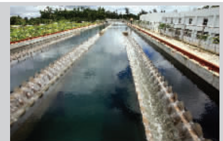
2008年文昌新建一座北山水厂,设计能力为日供水3万吨。图为文昌北山水厂沉淀池。

重视民生,改善民生,全面建设和和谐社会,已经成为文昌这座美丽城市一道最温馨的风景。