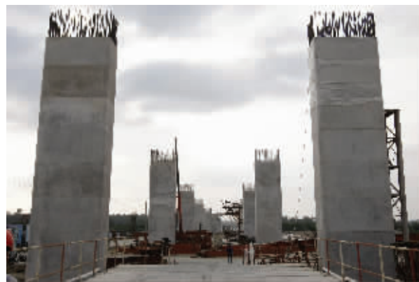
清澜大桥位于清澜港至东郊镇码头之间，横跨清澜湾，大桥全长为1828米。该桥于2009年8月开工建设，工期31个月，预计2012年竣工。目前，清澜大桥正按计划有力快速推进，18号主墩27根直径25米的大孔径钻孔灌注桩基础施工全部结束，标志着全桥的施工重点由基础施工转移到上部结构。

今年10月的二轮强降雨重创了侨乡文昌，当地党委政府迅速组织干部、党员、群众及子弟兵奋起抗洪救灾，以无一人伤亡的成绩取得了决定性的胜利。洪水刚退，文昌市立即采取有力措施确保水、电、路等基础设施在灾后第一时间畅通，有力推进了灾后重建工作。为做好重建家园工作和促进经济发展，该市又迅速做出决定一手抓恢复生产、重建家园，一手抓重点项目建设，夯实发展基础。