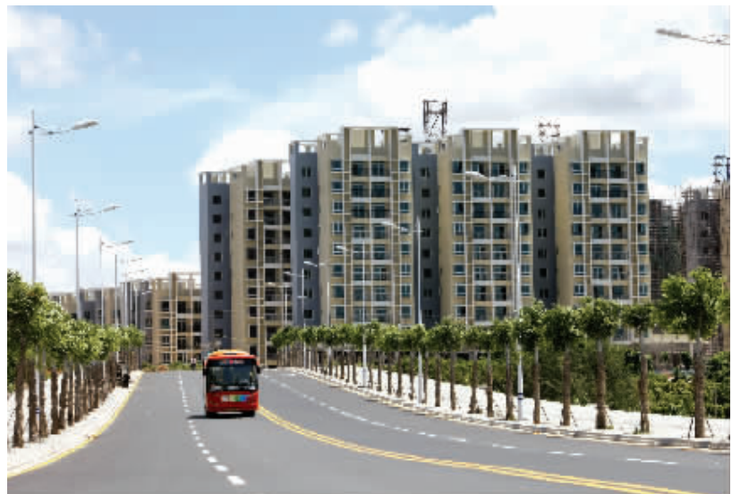
文昌桥中与教育东路之间的廉租房，于2009年2月底动工建设，目前部分房屋已交付使用，据了解，近年来该市共建1000多套廉租房。