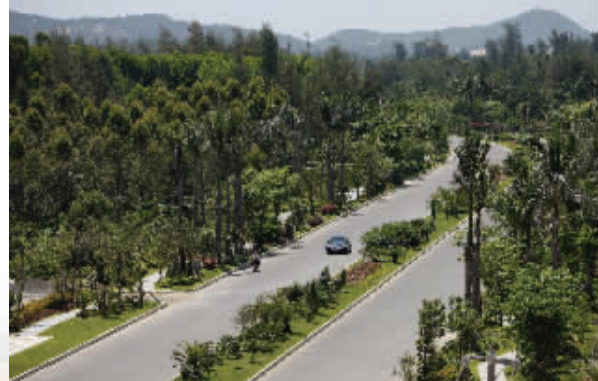
文昌铜鼓岭国际生态旅游区钻石大道全长6.3公里，双向四车道，目前已经通车