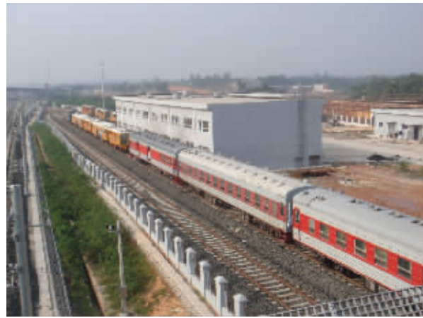
东环铁路文昌段文昌站

展现在人们眼前的，这一切不是远景而是即将实现的现实。重点项目，已经为文昌搭起发展的框架。