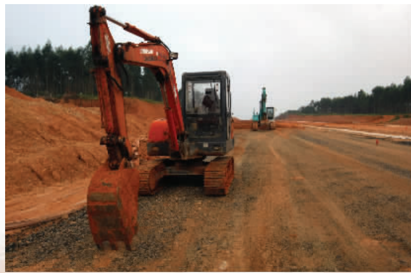
文昌市滨湾路于去年8月30日正式开工，总投资2.5亿元，总长7.5公里。目前，路基全部完工，近日将铺设柏油。