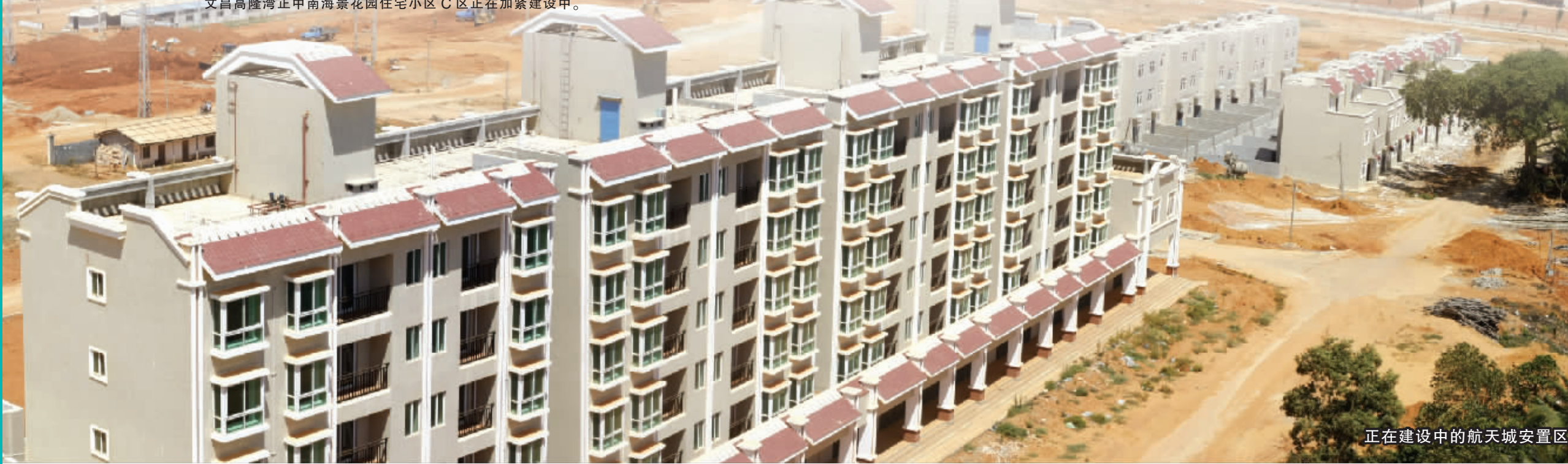
正在建设中的航天城安置区