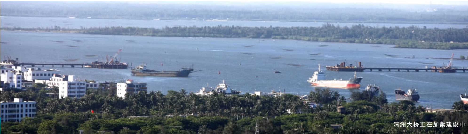
清澜大桥正在加紧建设中