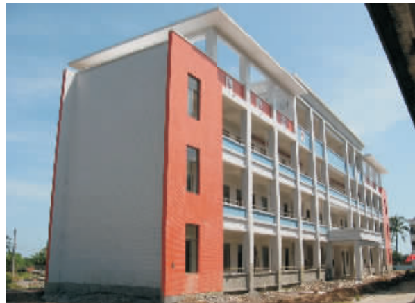
今年以来，文昌共投入5500多万元建设安全校舍改造工程。图为已竣工的冯坡中学校舍工程。