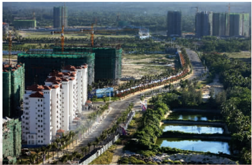
文昌高隆湾正中海景花园住宅小区C区正在加紧建设中。