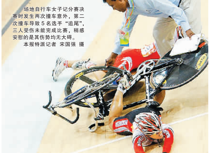
场地自行车女子记分赛决赛时发生两次撞车意外，第二次撞车导致5名选手“追尾”，三人受伤未能完成比赛，稍感安慰的是其伤势均无大碍。