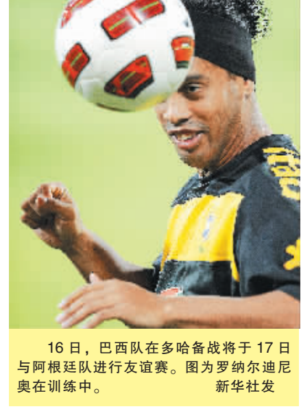
16日，巴西队在多哈备战将于17日与阿根廷队进行友谊赛。图为罗纳尔迪尼奥在训练中。

本报屯城11月16日电 (记者洪宝光 特约记者王光)今天，屯昌县举办首届太极拳比赛。来自全县各机关、企事业单位和各镇的20支隊伍1000多名太极拳选手参加比赛。最终教工队和交通建设队分获前两名。 太极拳刚柔相济，融健身养性于一体，是中华民族的优秀传统文化，它不受时间场地器材限制，适合各个年龄段人群习练。本次比赛项目为24式太极拳。