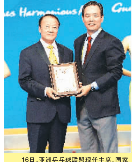
16日，亚洲乒乓球联盟新任主席、国家体育总局副局长蔡振华(右)代表亚乒联向他的前任李富荣授予了终身荣誉主席称号。

16日，巴西队在多哈备战将于17日与阿根廷队进行友谊赛。图为罗纳尔迪尼奥在训练中。