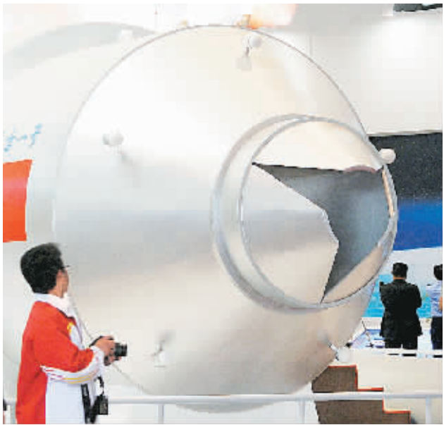
11月16日，观众参观“天宫一号”目标飞行器模型。