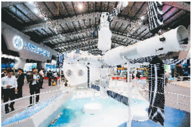
11月16日，观众在参观载人航天工程第三步——空间站的模型。