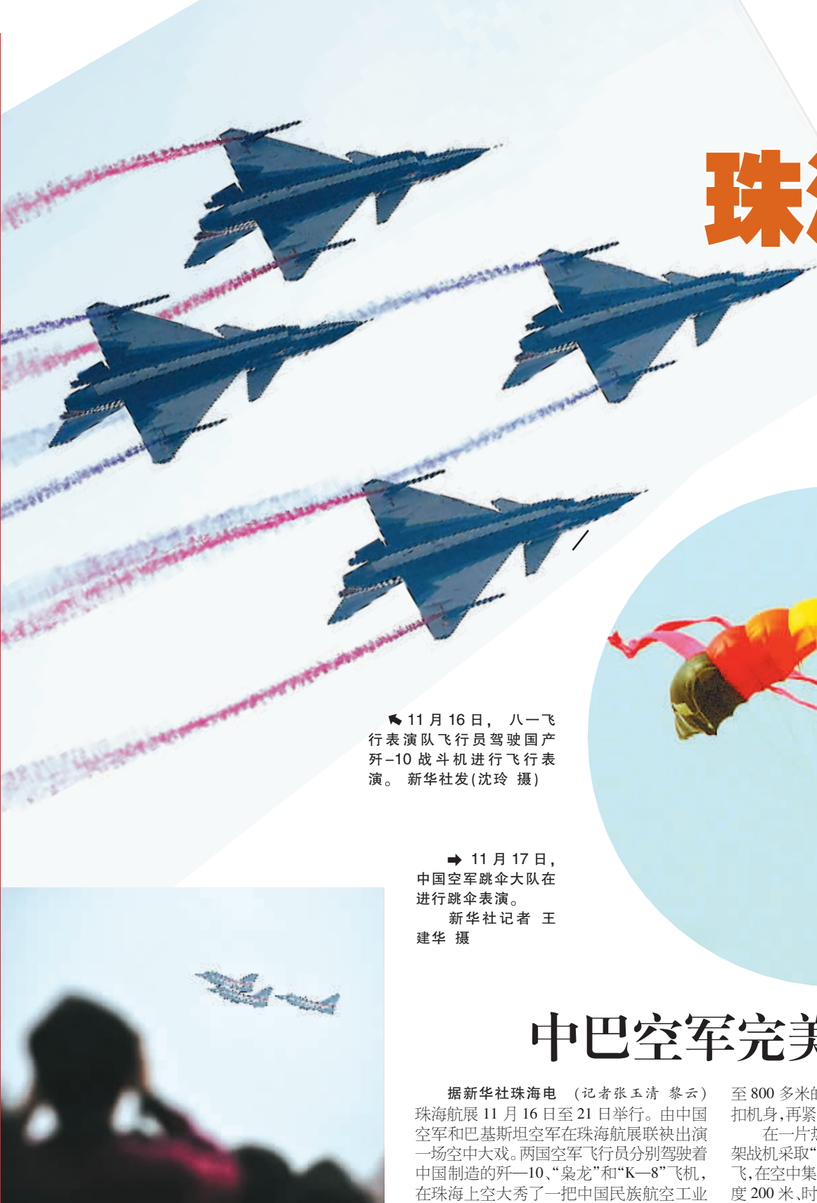
11月16日，八一飞行表演队飞行员驾驶国产歼-10战斗机进行飞行表演。