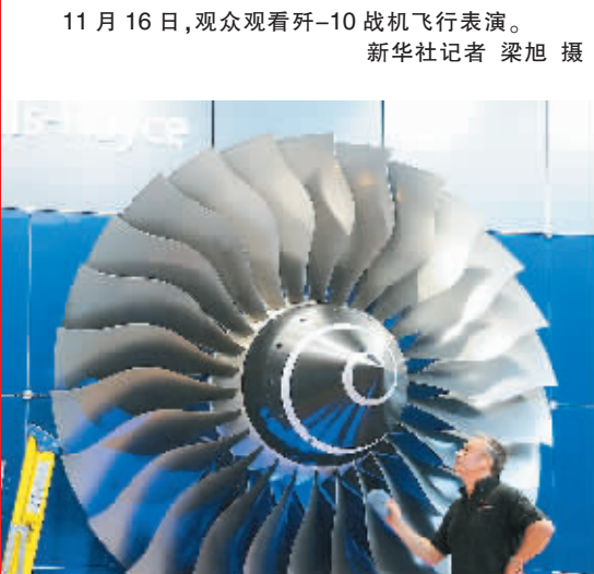
11月15日，一名工作人员在擦拭罗·罗公司展示的发动机叶片。

参加表演的歼-10军机次第着陆后，随即登场的是来自巴基斯坦空军飞行员驾驶的“枭龙”军机，这也是“枭龙”出口后，首次回到“娘家”的天空表演展示。“枭龙”的出场仍然以70度大仰度起飞拉开序幕。俯冲、蛇型扭转、多次横滚、低速通场，在空中表现得流畅而敏捷，特别是当“枭龙”连续翻滚后倒飞通场时，震撼了在场的很多观众。