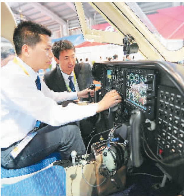
11月17日，参展人员为参会者介绍首款具有自主知识产权的轻型多用途水陆两栖飞机“海鸥300”的操作性能。