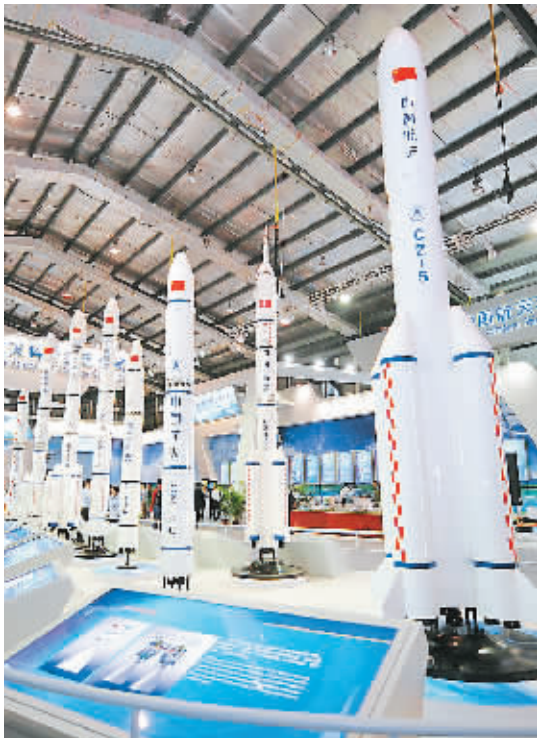
这是展出的新一代运载火箭模型（十一月十六日摄）。

活动详情请登录海南家居网（www.0898home.com）、海南企业信息网（www.hai180.com）《老成跑装修》栏目QQ交流群：109042922