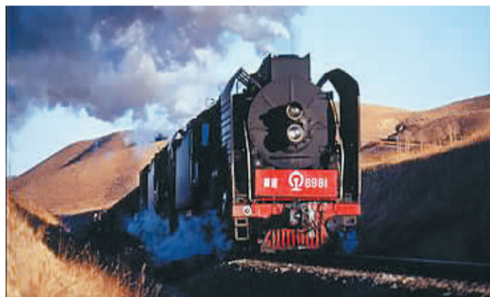
蒸汽机车穿越岁月,扩大了人们旅行的范围。