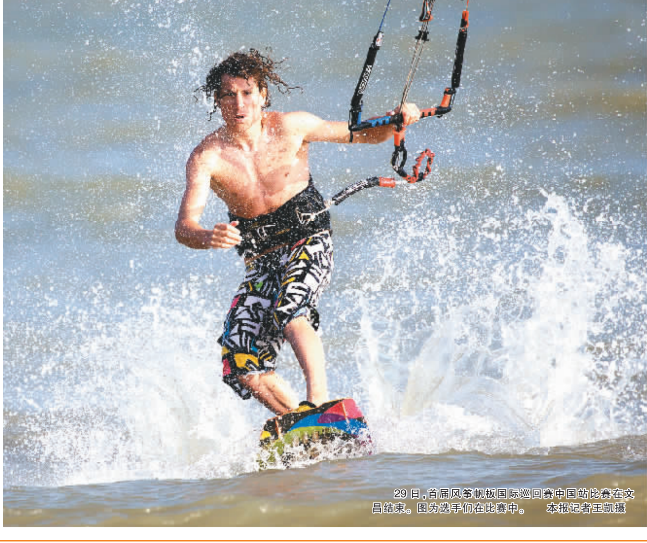
29 日,首届风筝帆板国际巡回赛中国站比赛在文昌结束。图为选手们在比赛中。

费德勒说,只要身体健康、而且还充满活力,他就会继续享受他的网球职业生涯。而现在,他压根没想过跟退役有关的事情。(据新华社伦敦 11 月 28 日电)