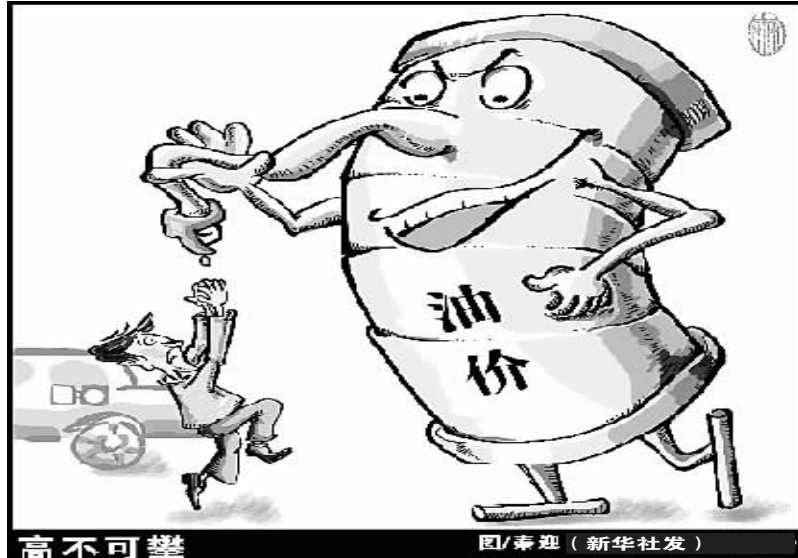
高不可攀

国际能源机构在11月12日发布的月报中预计2010年全球原油日需求将增长234万桶,较此前的预估值上涨19万桶,而2011年全球原油日需求将增长119万桶,较此前的预估值下调2万桶。但在供应方面,李山泉说,石油输出国组织(欧佩克)产量不会有大幅增长。同时,欧佩克在10月的会议上表示,将维持原油产量不变,2011年将每天增加50万桶供应。同时,美国能源部预计,2011年主要因为美国和俄罗斯等国家的石油供应减少,非欧佩克成员国原油