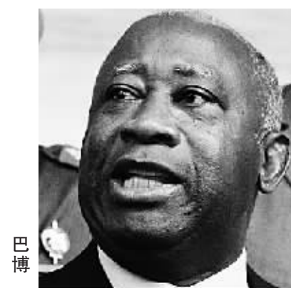
科特迪瓦总统选举结果争议引发的政治危机仍未显露出平息的迹象。7日,由宪法委员会宣布获胜的科特迪瓦总统、人民阵线党主席巴博公布其政府名单。而在两天前,他的竞争对手——由独立选举委员会宣布获胜的前总理、共和人士联盟党主席瓦塔拉也公布了其政府的成员名单。

分析人士认为,科特迪瓦对立双方各有优势与劣势,当地局势眼下尚未完全失控,表明两大阵营仍有和解意愿。但在僵持过程中,情况瞬息万变,这场危机最终能否通过对话和平解决目前尚难断言。