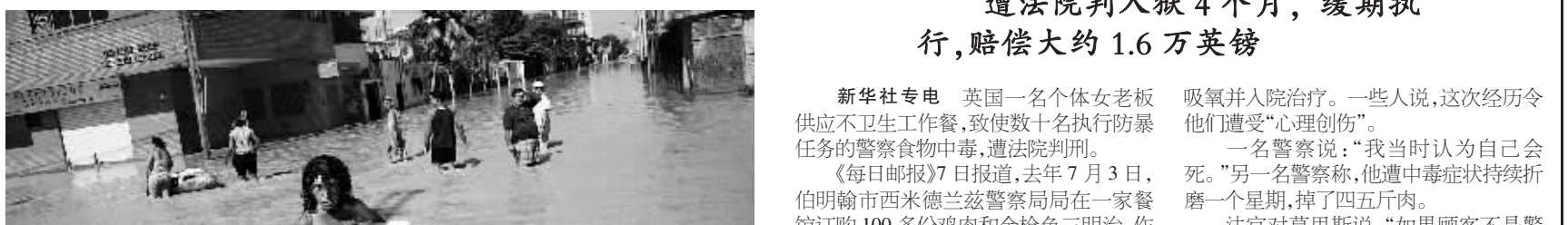
委内瑞拉连续3周遭遇强降雨,引发洪水和泥石流灾害,至少34人丧生。军队接管了多家私营酒店以安置灾民。