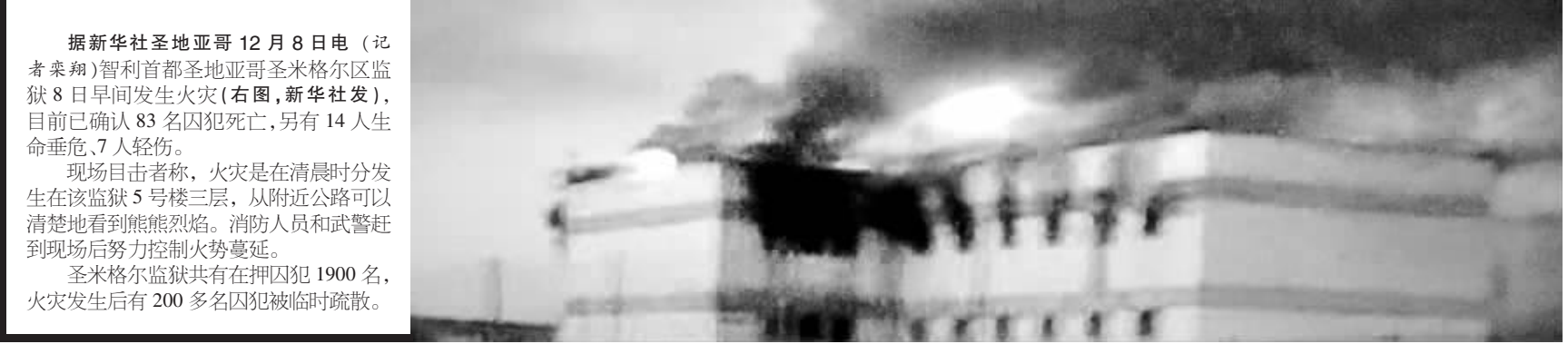
智利首都圣地亚哥圣米格尔区监狱8日早间发生火灾(右图,新华社发),目前已确认83名囚犯死亡,另有14人生命垂危,7人轻伤。

据新华社圣地亚哥12月8日电(记者秦翔)智利首都圣地亚哥圣米格尔区监狱8日早间发生火灾(右图,新华社发),目前已确认83名囚犯死亡,另有14人生命垂危,7人轻伤。