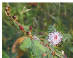
开毛茸茸小花的含羞草,可以成几何倍数无休止繁衍。

宋大祥院士曾在一次报告中提醒海南:海南光温、水热、土壤条件都很好,不仅适合本地生物生长,也适合外来生物生长。在缺乏天敌的情况下,外来生物一旦进入海南,就会很快找到适合种群繁衍扩散的空间,产生巨大危害。因此,应像防止军事入侵那样防止有害生物入侵。