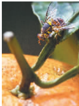
一只桔小实蝇在蜜橘上寻找产卵地。