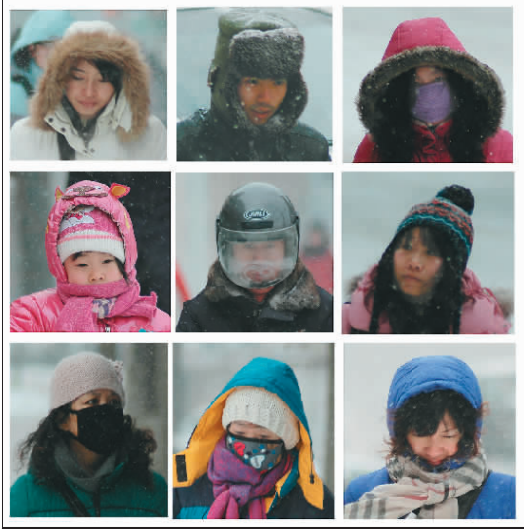
辽宁近日迎来寒潮降雪天气,沈阳市民“全副武装”冒雪出行(拼图)。

当地政府部门现已投入人员、机械,实施紧急救援工作。近来通辽市一些地区多次降雪,加上大风天气的影响,14日304国道部分低凹路段迅速被厚厚的积雪覆盖,能见度很差,车辆难以通行。