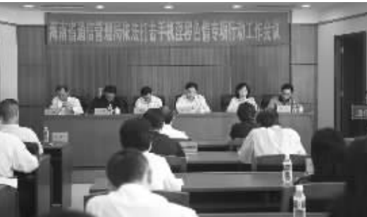
2009年12月，海南省通信管理局召开打击淫秽色情专项行动工作会议，对我省打击手机淫秽色情专项行动进行部署。