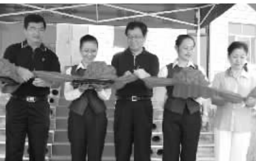
2006年7月23日，南开乡牙和村开通电话，海南实现全省行政村 100% 通电话。