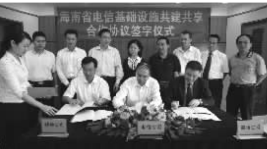
2009年2月，海南省内3家电信运营企业签署通信基础设施共建共享合作协议。