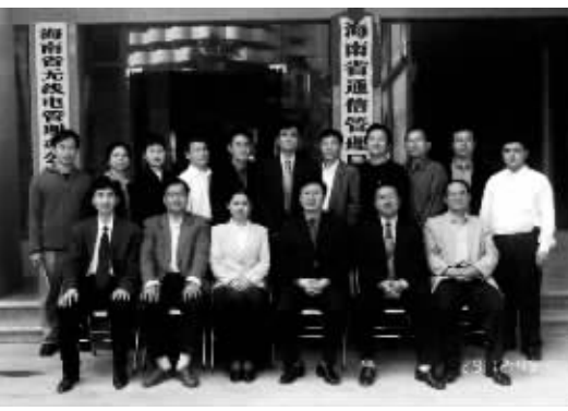
2000年12月16日，海南省通信管理局正式挂牌成立。