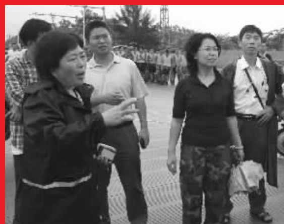
2010年国庆期间，海南遭受持续强降雨袭击，省通信管理局组织开展抢险救灾通信保障工作。