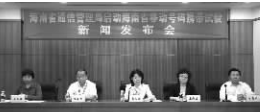
2010年11月9日，海南省通信管理局召开海南省移动号码携带试验新闻发布会，宣布自11月22日起，启动海南号码携带现场实验工作。