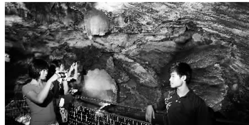
游客在儋州石花水洞内拍照留影。

儋州市商务局主要负责人表示，要通过加强卫生管理，把美食品鉴会办成展示儋州美食的“窗口”，不断提高儋州美食的知名度和美誉度，吸引更多的人到儋州休闲观光度假。