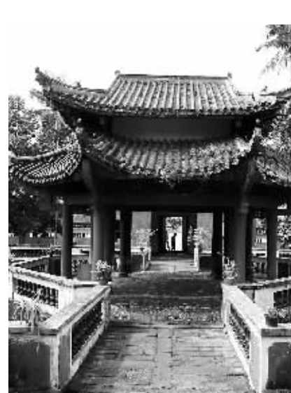
东坡书院内的载酒亭。