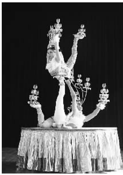
杂技《滚杯》。(资料图片)

新华社北京12月16日电(记者廖娟)在文化部16日在京主办的中国杂技(魔术)艺术发展论坛上,文化部部长蔡武说,这些年来,中国杂技艺术取得了一系列可喜成绩,但作为杂技艺术资源的大国和古国,由于种种原因,尚未能发展成为世界杂技艺术强国。