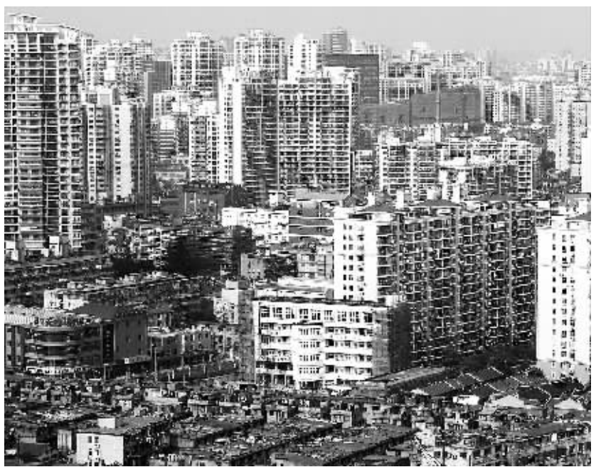
上海商品住宅成交均价重回每平方米2.3万

阅读提示: 截至目前,今年以来的楼市已经历三轮调控,其出招之快、力度之猛,被一些房地产人士称为“史上最严”的调控。重拳猛药之下,楼市呈现出积极变化。但眼下各地的“翘尾”,当引起足够警惕。明年新开工面积增加、保障房建设提速等将使调控面临有利形势,但通胀预期、热钱涌入等因素也将明显增加楼市的不确定性。