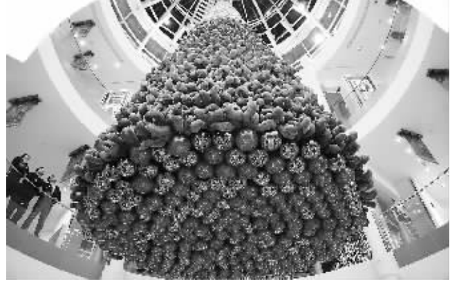
近日,在黎巴嫩首都贝鲁特一家商场,上千只泰迪熊组成的圣诞树状装饰物悬挂在天花板上。在圣诞节即将到来之际,黎巴嫩首都贝鲁特举行了一项名为“小小的熊,大大的心”的慈善活动,出售2000只泰迪熊的收益将会捐给黎巴嫩的自闭症患者。

美国人保罗·怀特现年70岁,身处山区,离家2400多公里,所坐车辆由陌生人驾驶,目的地未知。怀特没有遭绑架,而是参加神秘旅游,由他的妻子花两年时间筹划。自离开位于马萨诸塞州东桑威奇的家,他对15天行程一无所知。这种神秘旅游,正在一部分美国人中间悄然兴起。