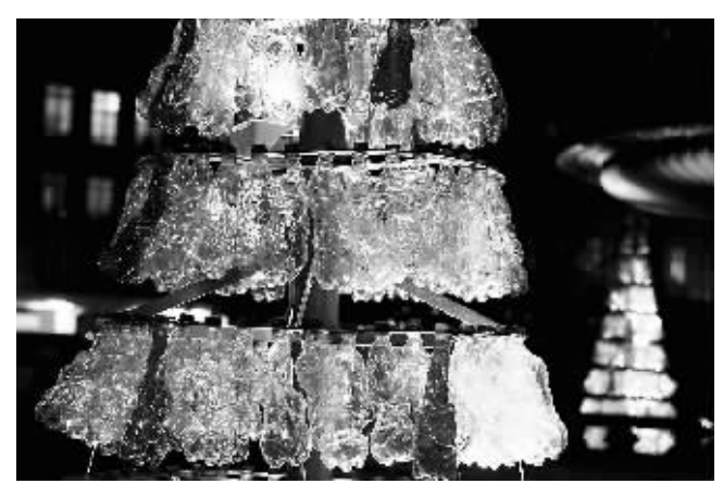
这是12月21日在法国巴黎街头拍摄的用废弃饮料瓶制作的环保圣诞树。这些圣诞树全部使用可循环利用的废弃塑料瓶,旨在提倡环保,支持低碳和可循环利用。这些环保圣诞树在一个名叫DE-SIGNPACK的画廊出售,每颗售价69欧元,其中2欧元捐给世界自然基金会。

研究负责人弗拉基米尔·佩图霍夫表示,除了上述原因,今冬太阳活动的减少以及墨西哥湾暖流的变化也加大了欧洲地区的降温幅度。世界气象组织日前公布的数据显示,2010年“几乎肯定”将成为1850年有气温记录以来年平均气温最高的三个年份之一。拉姆斯多夫表示,这一结论与欧洲部分地区经历的寒冬并不矛盾。他举例说,在德国遭遇大雪和严寒的同时,格陵兰岛12月份的气温已攀升到零摄氏度以上。