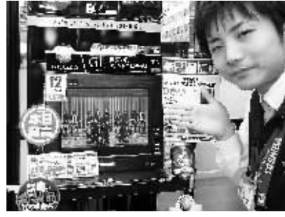
12月22日,在日本东京一家电器商店里,店员介绍一款东芝公司新推出的不用戴眼镜观看的3D液晶电视。东芝公司当天开始在日本销售这款电视机。