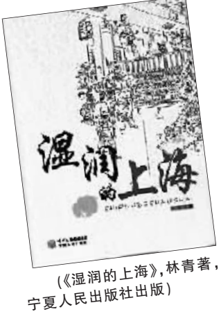
《湿润的上海》,林青著,宁夏人民出版社出版

读文学可以让人读得荣辱不惊,读出的好心情来应对繁杂的公务和人事,下班后仍有好的脸色回家同妻儿共进晚餐、入梦乡。然我时时警醒自己,不可太过于沉迷其中,因文字之贵,虚幻多于现实,毕竟“工作着是美丽的”。年初,一位大学同学从香港来琼度假,他赠我两本书:《公文写作》和董桥散文集《从前》,这是一位深谙我禀性的老朋友,我恭敬地将两本书放置在我的办公桌上,一如既往地打发着我的职业时光。