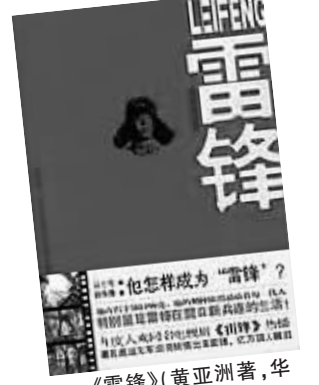
《雷锋》(黄亚洲著,华夏出版社2010年出版)