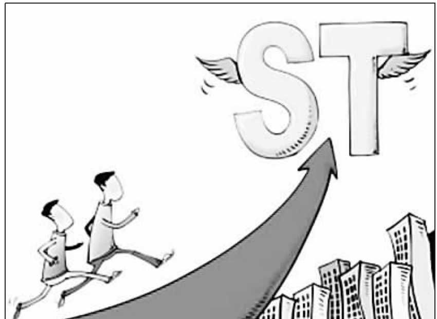
年初还头顶“ST”帽子的广晟有色借着今年4月第一波稀土行情开始崭露头角,最终一飞冲天。

订30亿元大单,此消息激励金螳螂当日复牌后快速封住涨停。但其在公告之前金螳螂的股价早已不声不响地翻了数番,并持续创出新高。作为装修行业龙头,公司业绩持续超预期,2009年间涨幅就已达172.56%,是当之无愧的“长牛型”股票,耐力与爆发力兼具。