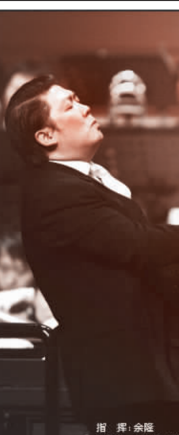
指挥:余隆 主持人:刘芳菲、任鲁豫