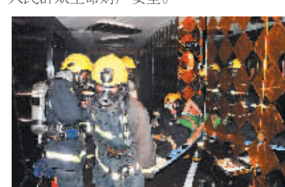
三亚消防官兵在进行实战演练。

艺、营业性演出、影剧院等文化娱乐场所存在的安全隐患，对排查出的隐患，要逐一登记注册，监督隐患整改落到实处，确保人民群众生命财产安全。