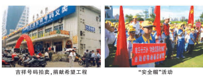
吉祥号码拍卖,捐献希望工程