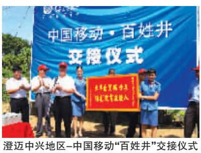
澄迈中兴地区-中国移动“百姓井”交接仪式

2004年8月9日,被称为海南“小西藏”的昌江王下五乡基站开通了,海南最后一个不通电话的乡镇从此也成了历史。对一个只有3000人左右的“袖珍乡”不计成本地使用了卫星通讯,这在海南的通信界可以说史无前例,但海南移动做到了。