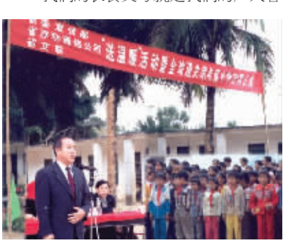
“全球通希望小学落成”剪彩仪式

“责任海南”是海南移动在2005年提出的公益活动主题口号。在公司发展的各个阶段,海南移动都把社会责任放在突出的位置,做好通信保障工作,自觉履行社会责任,做优秀的企业公民,为海南发展贡献一份力量。