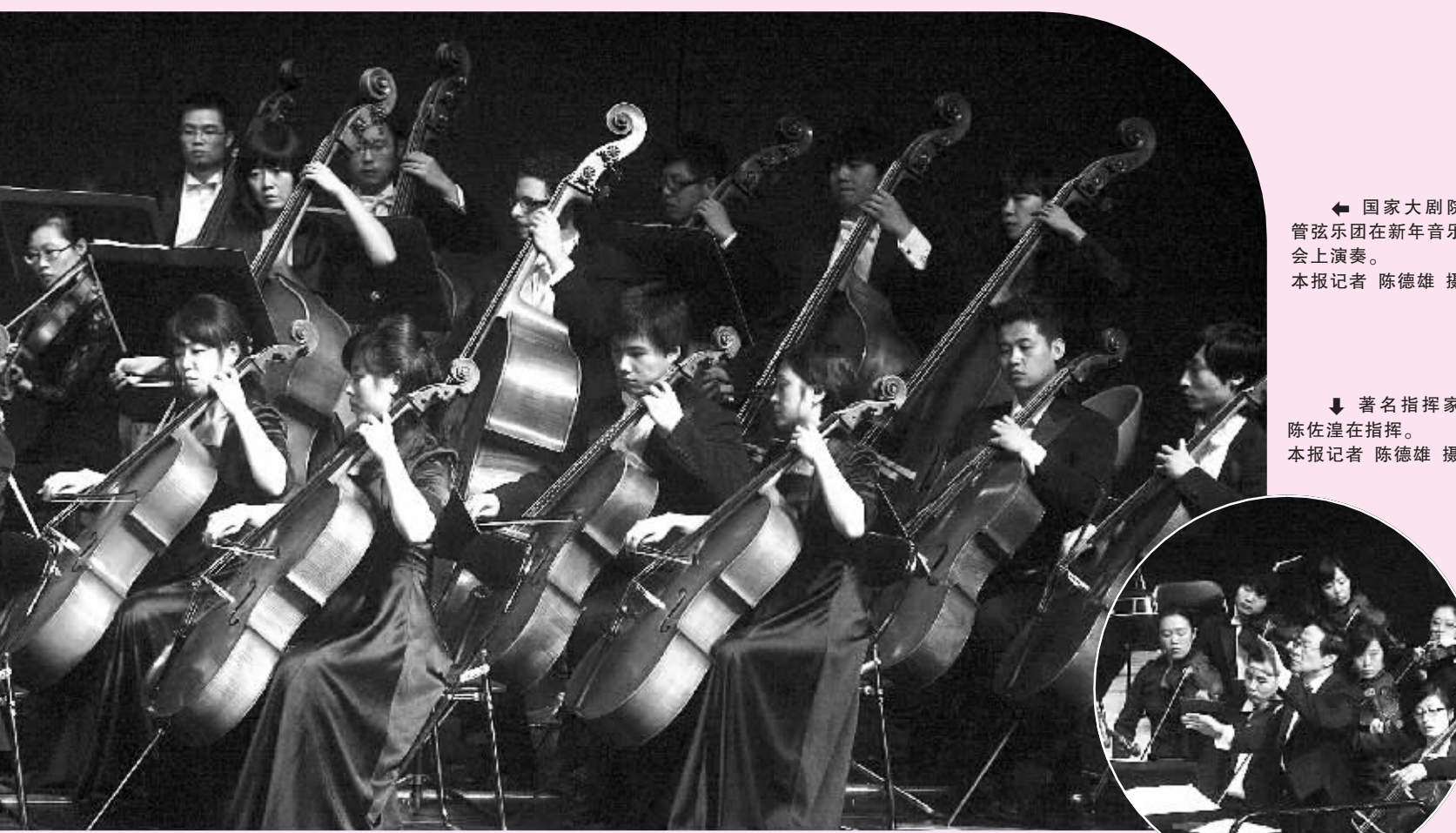
国家大剧院管弦乐团在新年音乐会上演奏。

《第五空间》聚焦于这群年轻的80后飞行员身上，着力体现年青一代经过抗震救灾、奥运会举办成长起来的风貌。该剧以姜蓉、沃威、白羽、汤名扬和关怀五位85后陆航军人的学习、训练和生活为主线，以他们的成长历程为脉络，以陆航直升机为载体，将他们的友情、爱情、矛盾、冲突等等故事融入其中。(晓文)