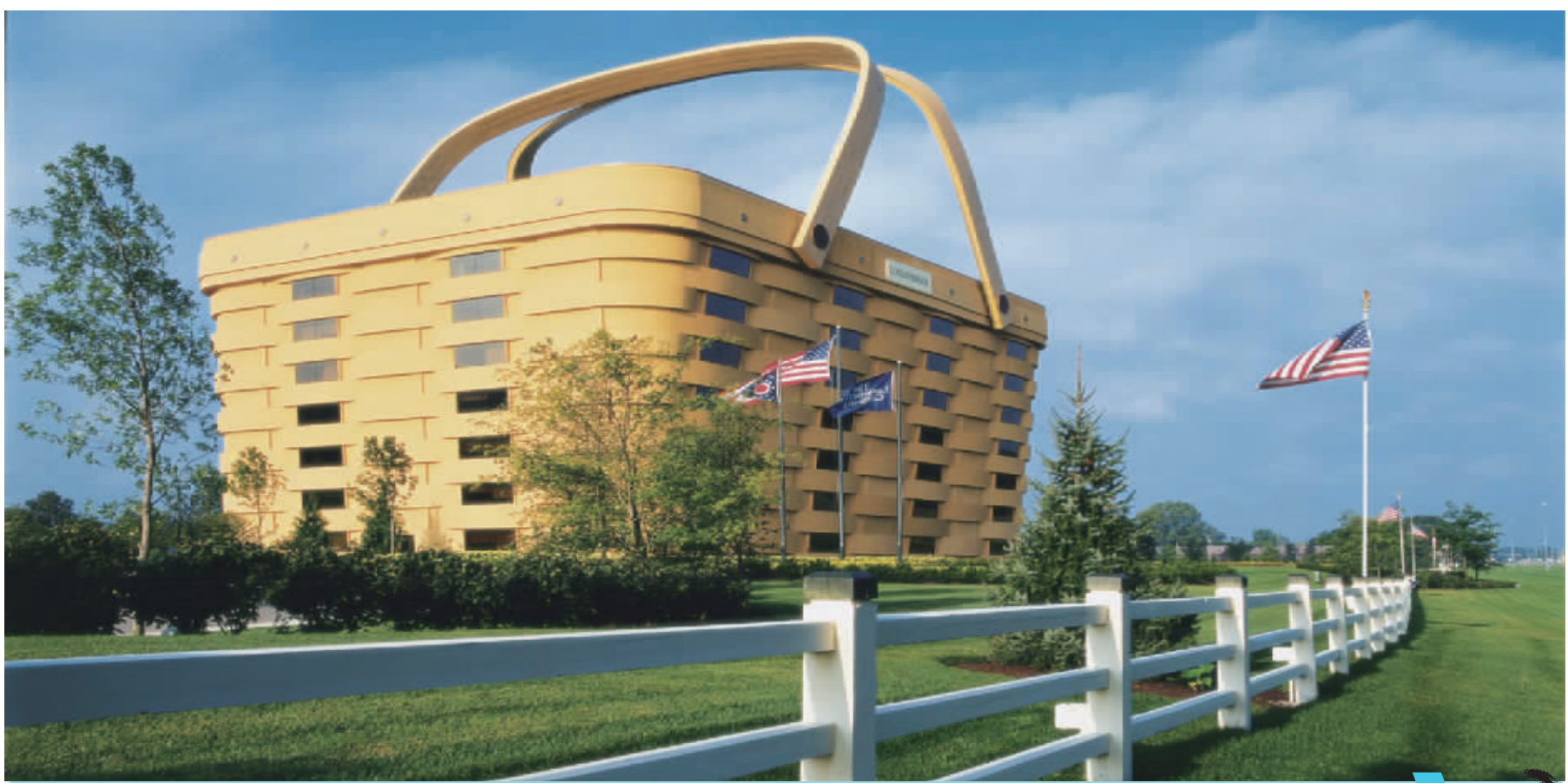
美国隆加伯格公司总部 美国隆加伯格公司是美国首屈一指的手工篮子制造商，并提供其他优质家居和生活用品，其总部大楼是2010年7月投票产生的“美国七大奇迹”之一。这个“巨大的篮子”完全照他们公司的产品-野餐桌设计，只是它比实物大了160倍，七层楼高，由美国著名建筑事务所NBBJ设计。它颠覆了一般美国企业的保守形象，比起其它标新立异的普普通通建筑，它的设计有意义得多。

对于三亚车房联展我非常有信心，这是选择了最合适时机、最温暖的城市，而且有着最具消费力的人群的一次房展，就像广告里说的，“不用南征北战就可以坐拥高端！”相信长信地产从品牌实力展示、项目认知推广及客户积累上都会有很大的收获。